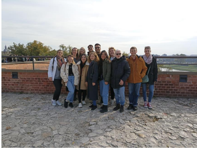
與宿舍交換生到瓦維爾城堡參觀