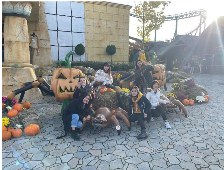
克拉科夫的游樂園——Energylandia