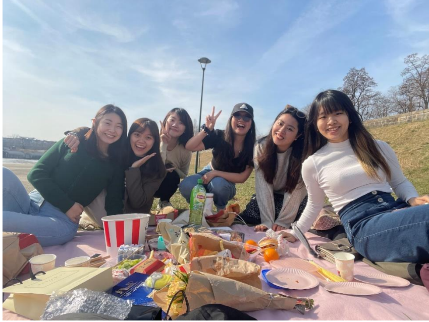
臨走前與朋友的野餐歡送會