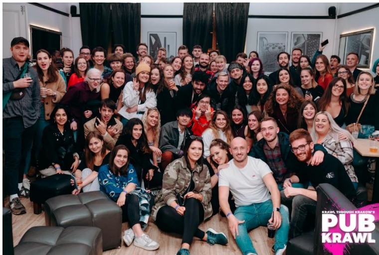
迎新活動——酒吧路跑