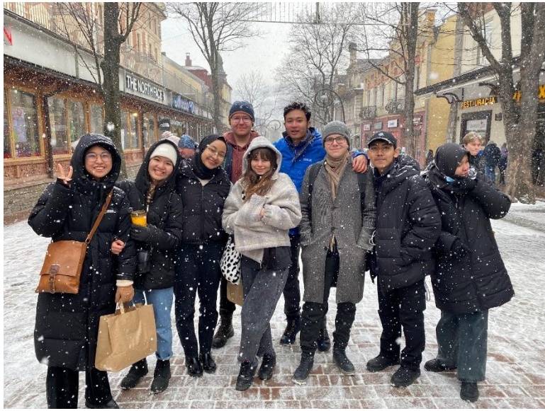
與交換生到克拉科夫的扎克帕內觀光