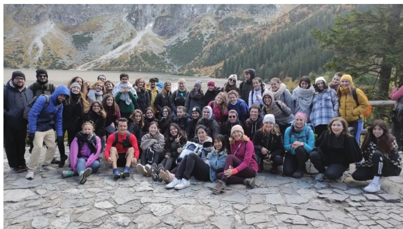
迎新活動之一：登山——波蘭的海洋之眼 山脈的另一邊是斯洛伐克