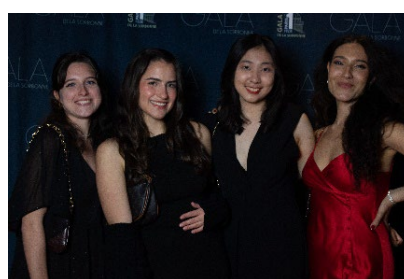
和來自比利時、德國、美國的朋友一起參加學校的期末舞會。