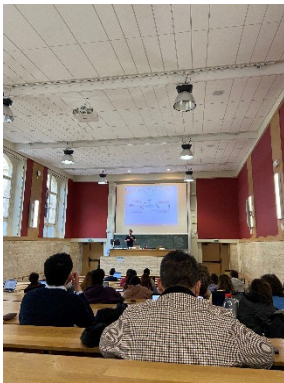
在主校區上國際金融課。