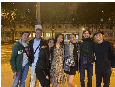
離開法國的前一晚和交換生朋友聚會。