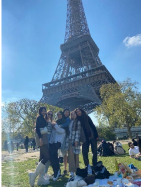
和交換生朋友在巴黎鐵塔前的戰神廣場野餐。