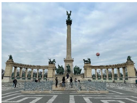
第一次獨旅——匈牙利布達佩斯