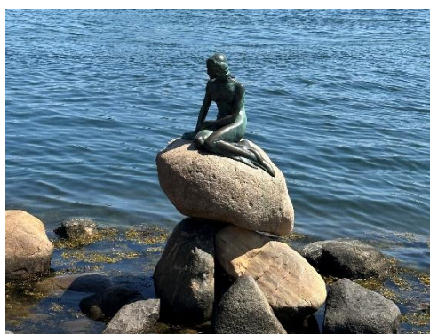
歐洲最貴國家——丹麥哥本哈根