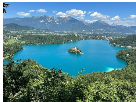
斯洛維尼亞 Bled Lake