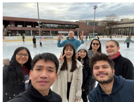
當地學生帶我們去滑雪