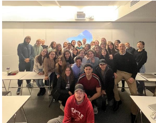
新創課程全體師生合照