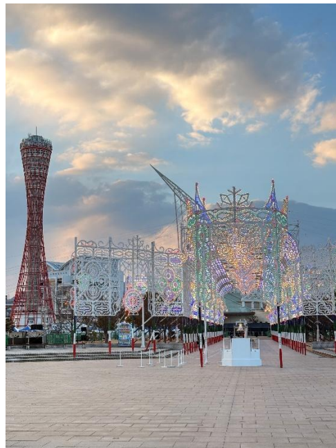
在メリケンパーク的燈光秀和神戶塔