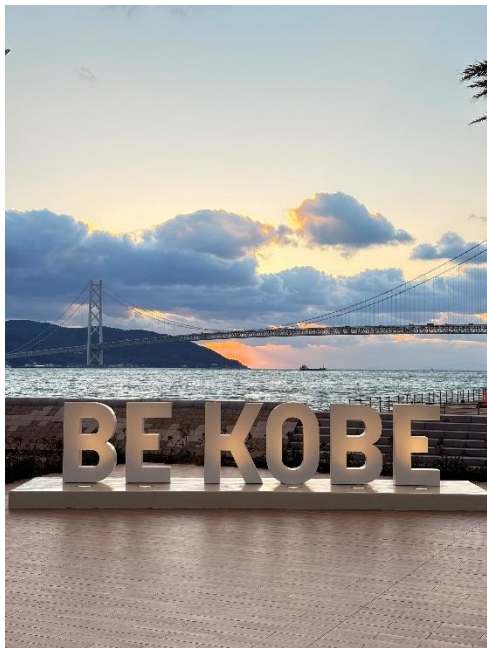
最直觀可以代表神戶的地點