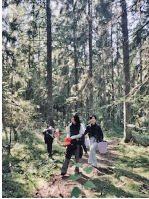
(右) 去森林採野生藍莓 (左) 圖爾庫大學人文學院