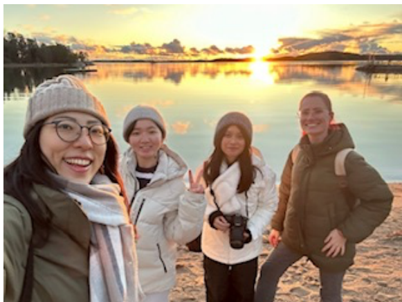
Ruissalo (圖爾庫的美麗小島)