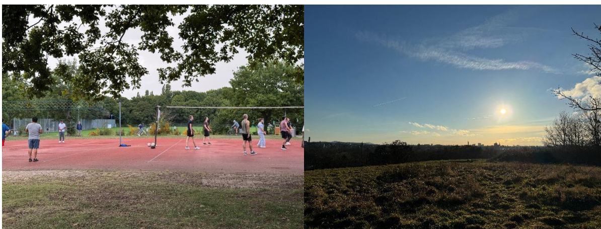
Bürgerpark 裡面的球場以及制高點的景色

平日在達姆施塔特時是住在學校外包的宿舍，因此不需要額外尋找。我在達姆施塔特是住在 Karsholf 這區，附近有一個很大的市民公園 Bürgerpark，平常有空閒的時間都會去公園散步及慢跑，公園裡面也有體育場和游泳池，偶而也會走到公園的制高點上看風景。我是住在六人的家庭式宿舍，有兩間廁所、一個廚房以及大客廳，平常大家都會待在自己的房間內，大部分都是在主飯時會遇到室友，因此可以趁這個機會跟室友進行食物及文化上的交流。