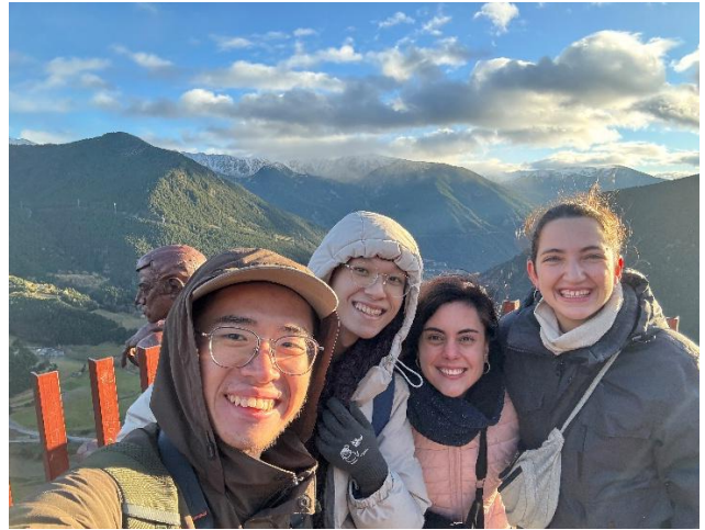
在安道爾山上願意在我們下山的西班牙朋友