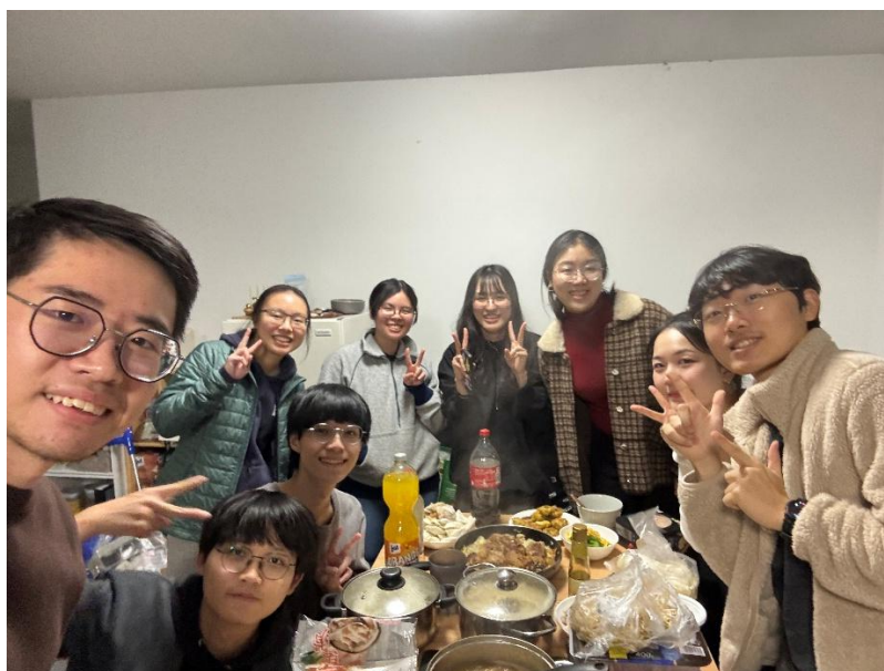
與來自香港、韓國的交換生一起準備年菜

交換生還有一個娛樂就是晚上找鄰居們一起聚餐，偶爾大家聚在一起煮飯，一人準備一道拿手菜，整桌就會是滿滿的家鄉味，可以緩緩我們的亞洲胃，當然在農曆新年時也和其他來自亞洲的交換生一起圍爐。