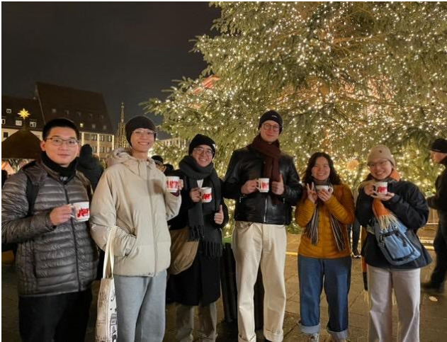
跟德國的朋友一起逛聖誕市集