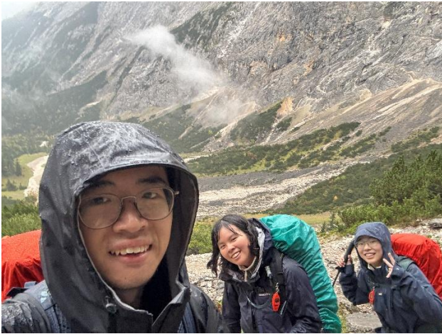
與同行友人爬德國最高峰 Zugspitze