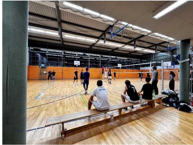
排球俱樂部的有誼賽

達姆施塔特大學也有提供 Unisport 讓我們可以免費的參加運動，我候補了很久才終於選到排球的進階課程，這個課程會提供場地以及會由教練帶領，我也在這邊認識了球友，並一起去參加更高階的排球課程。另外也非常推薦去達姆的抱石場 Boulderhaus Darmstadt 抱石，裡面的牆面大概有兩、三層樓高，抱得非常過癮，我也是來德國被同行的友人找去一起抱石，然後就愛上這運動了，而且每周一有學生優惠。