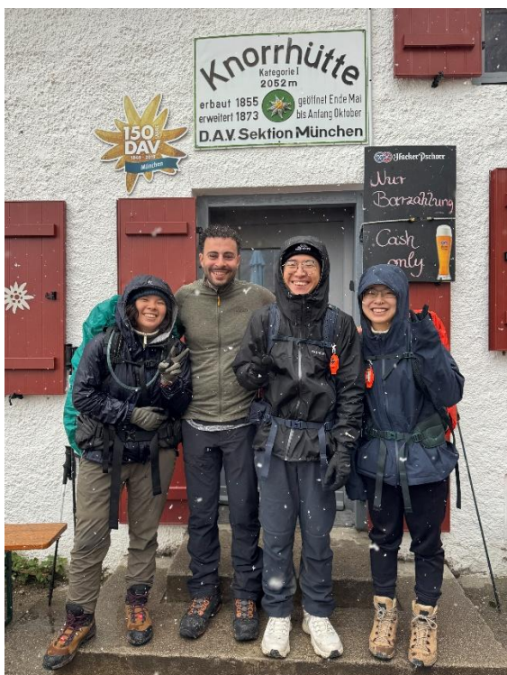
爬最高峰時認識的德國山友