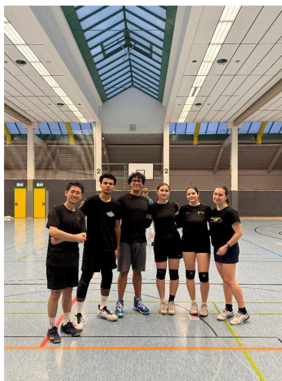
跟在排球場認識的法國朋友與他的朋友們一起打排球賽