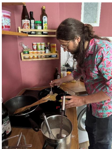
跟德國人一起製作手工台式蛋餅