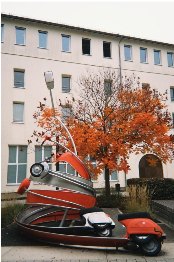
學餐前的裝置藝術與秋葉