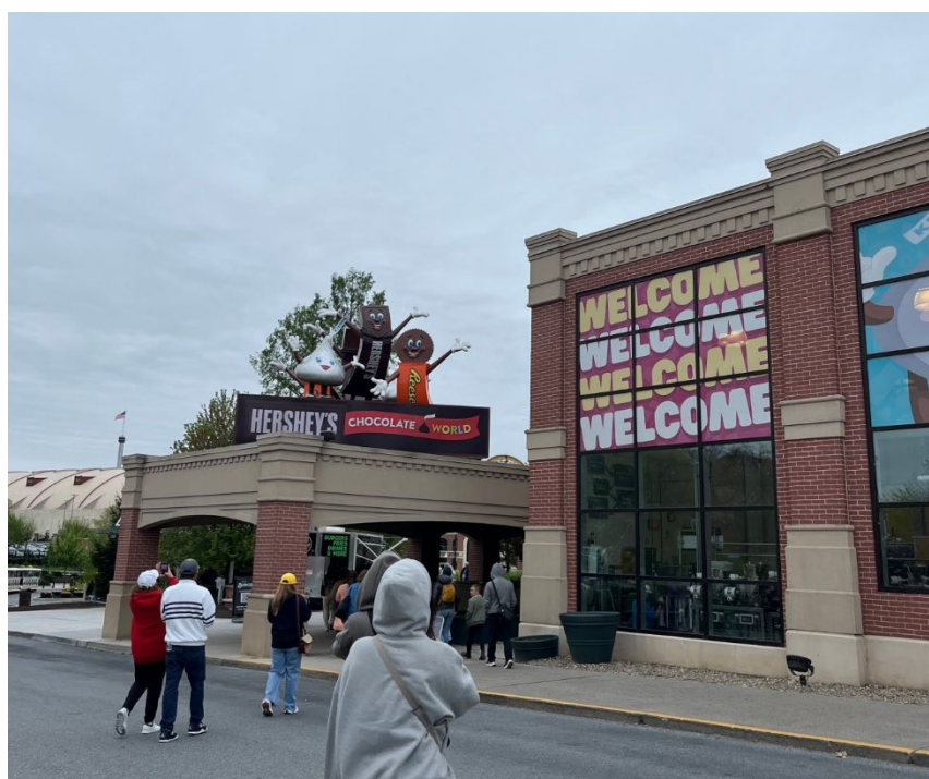
Global Program 活動：Hershey's Park