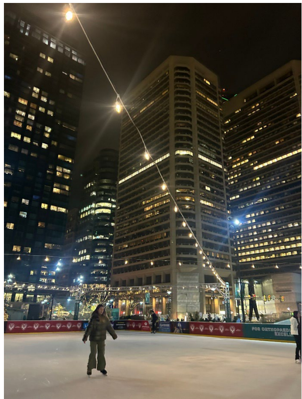
Global Program 活動：溜冰