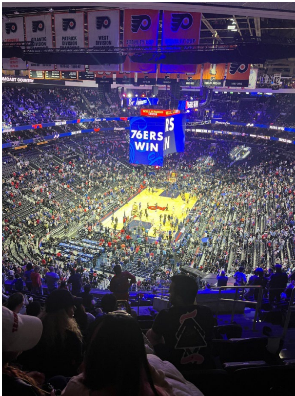
Global Program 活動：看 NBA