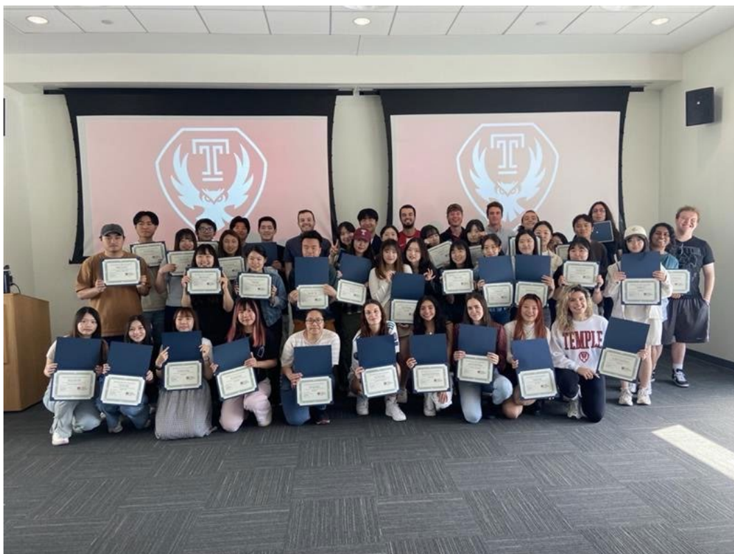
Global Program 結業合照