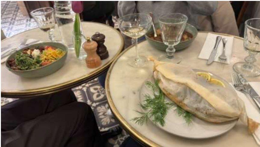
圖5. 與學校認識的香港和韓國朋友一起享用維也納的法國料理