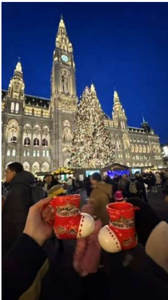
圖4. 與學校認識的香港朋友一起逛維也納聖誕市集