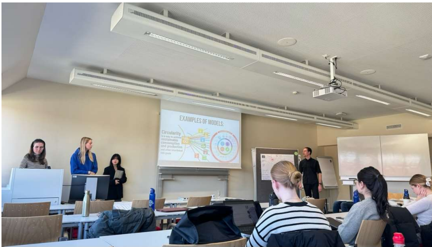
圖2. Modern Business Concepts 課堂學生報告