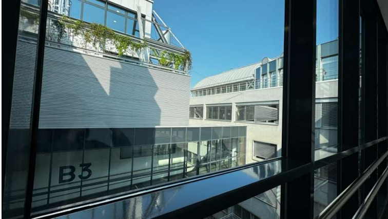
圖1. 學校窗戶看出去的校園景色