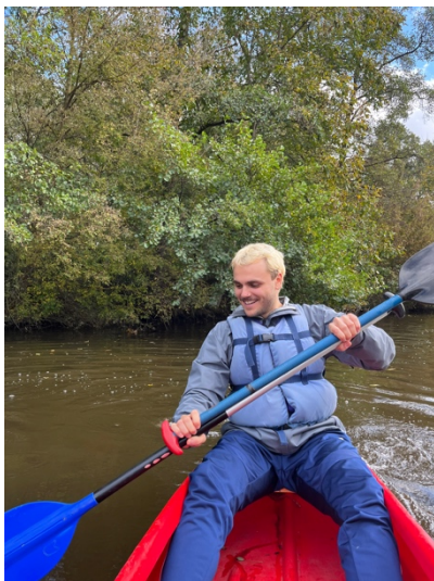
～體育課去划獨木舟