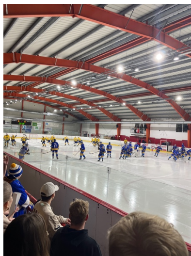
～替馬大冰上曲棍球隊加油