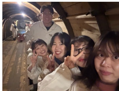
～和其他國家的交換生一起出遊