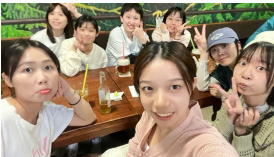
～和台灣交換生一起中秋聚餐