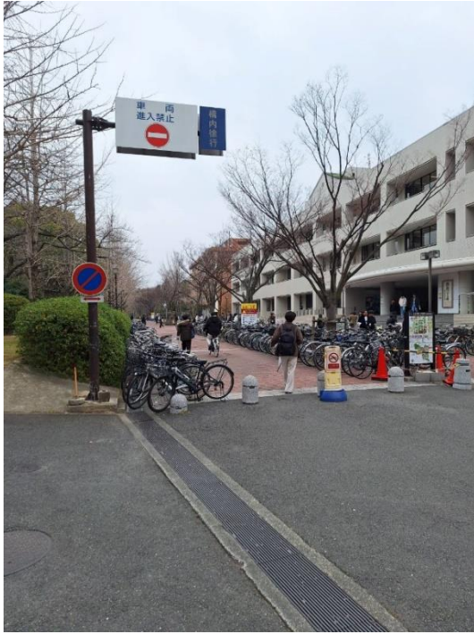
大阪大學豐中校區