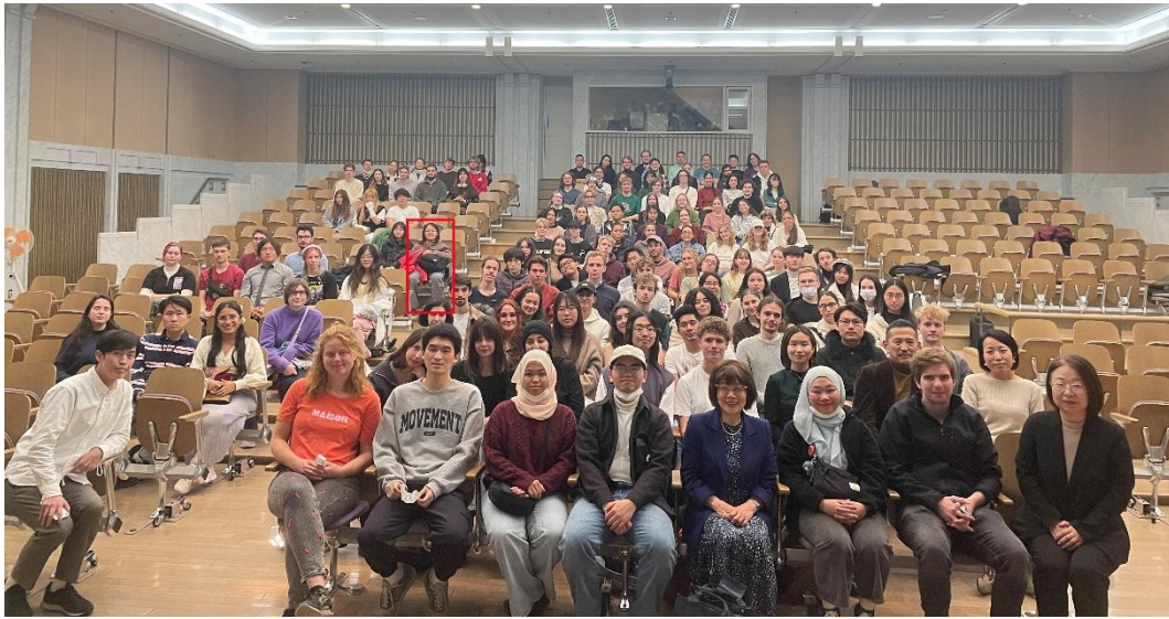
廣島原爆倖存者分享會(紅色外框為本人)