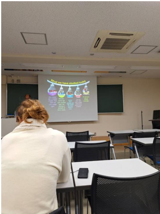
課間(應用物理學入門)