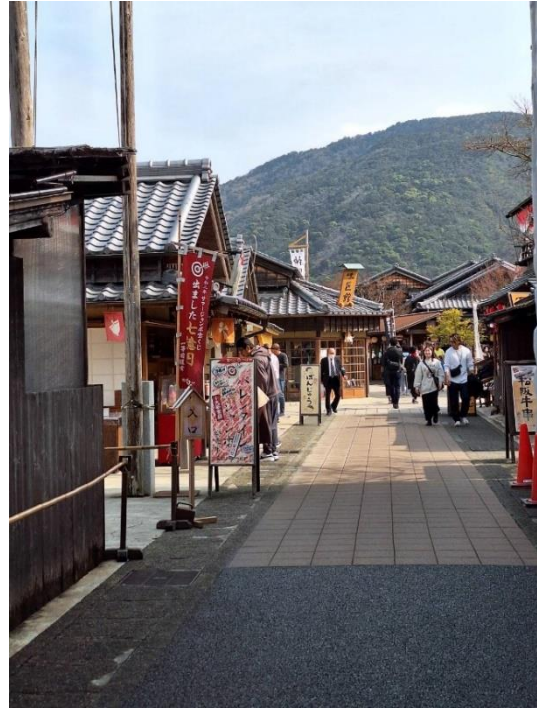
伊勢神宮內宮旁街道