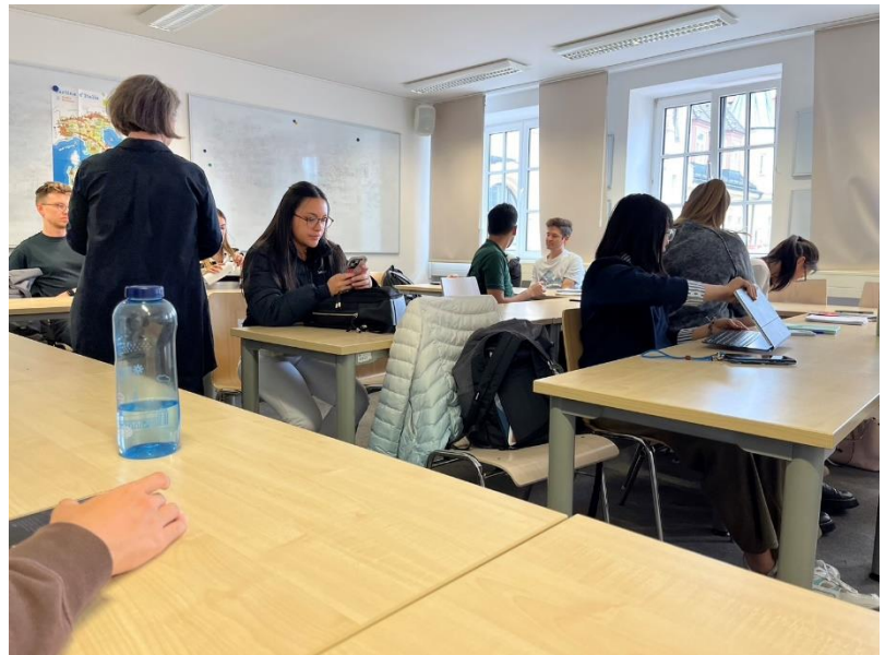
Figure 4 German Class