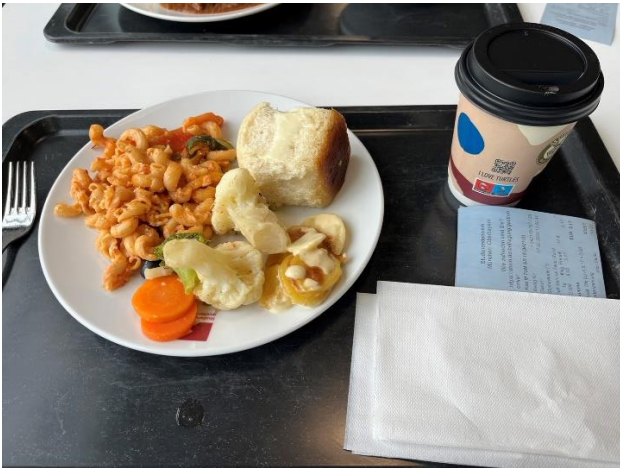
Figure 1 Mensa - Lunch