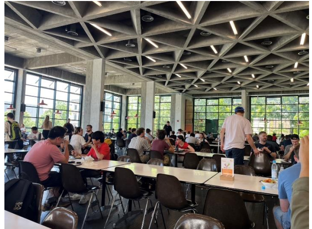
Figure 2 Mensa – Main campus