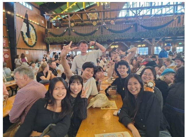
Figure 6 Oktoberfest