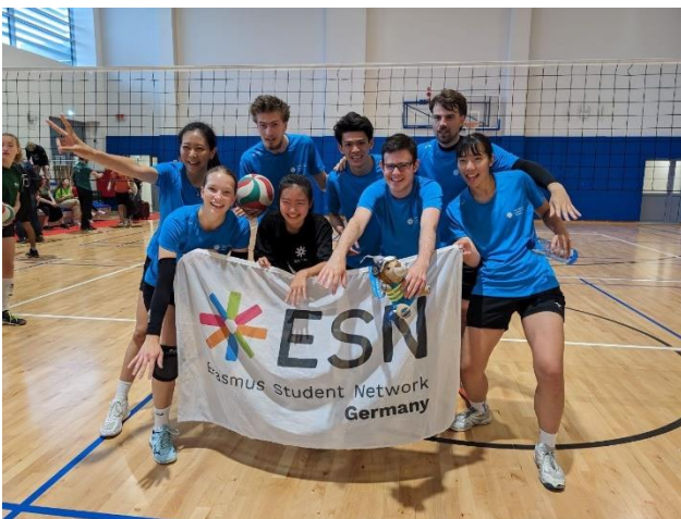
Figure 5 International Erasmus Game - Volleyball