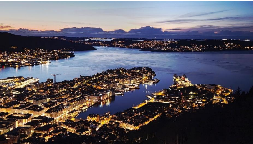
圖6:在 Fløyen 上的藍調時分。