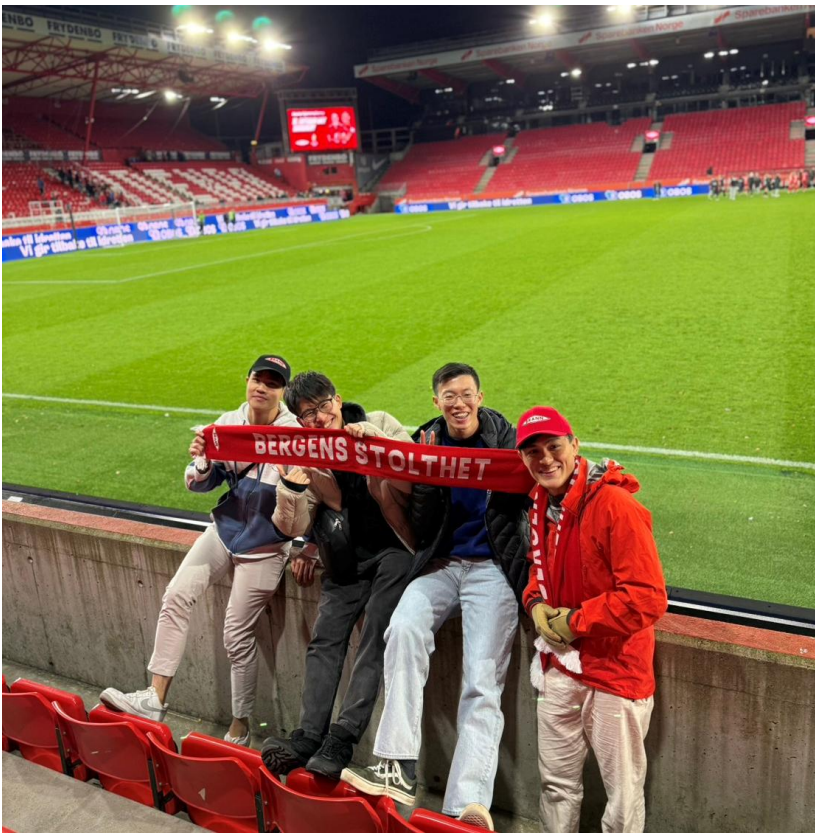
圖8: 跟朋友一起去看足球賽，地主隊超強。