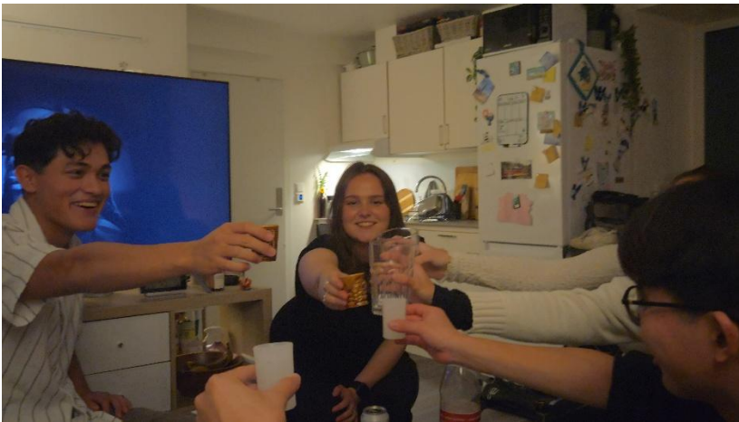
圖7: 在朋友家喝酒玩啤酒遊戲。