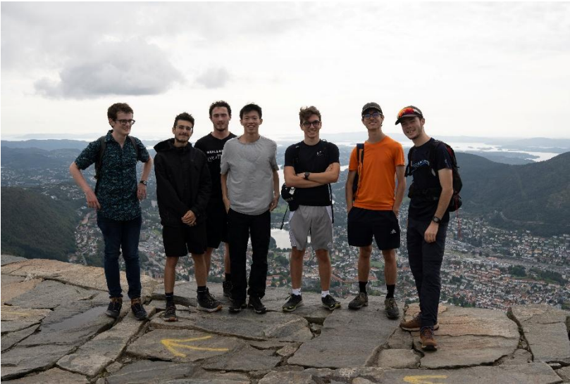
圖5:跟法國朋友們一起爬 Ulriken。