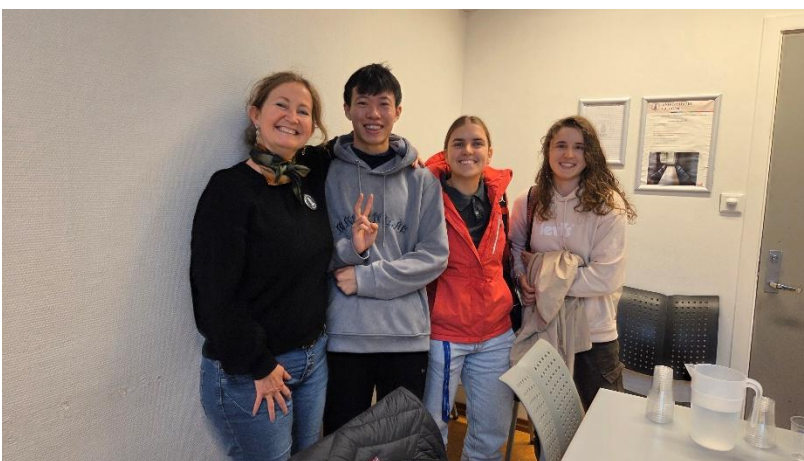
圖3:挪威語課期末口試後開心與老師及同學們合照。