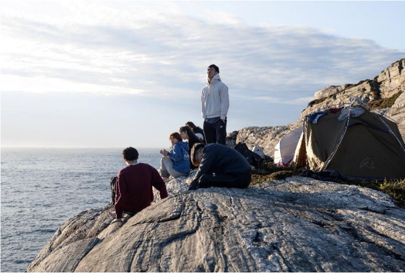
圖4:跟朋友們一起去 Bekhilderen 海邊露營、游泳、看星星。