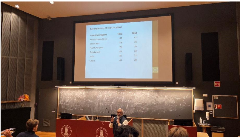
圖2:在學生中心大講堂裡上的發展經濟學。