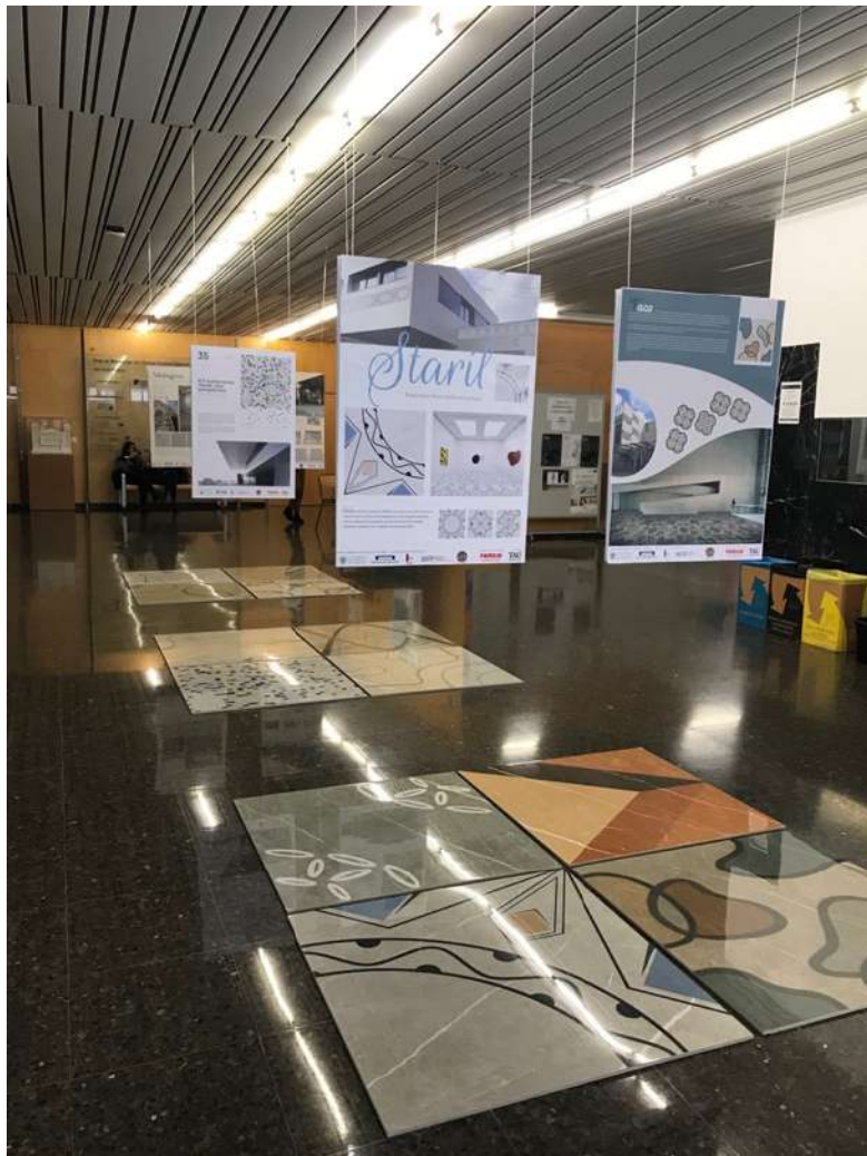
圖 2 學生設計成品與海報在建築系館展出