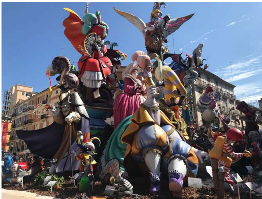
圖 6 街道上的法雅人偶