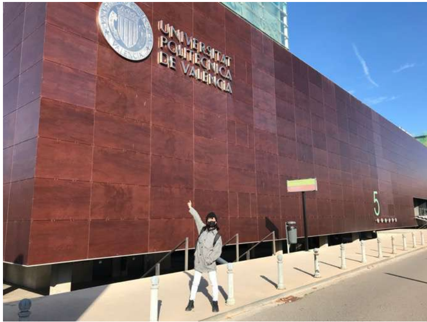
圖 1 瓦倫西亞理工大學