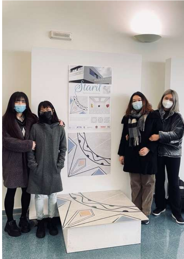
圖 3 組作品 (我-左二)