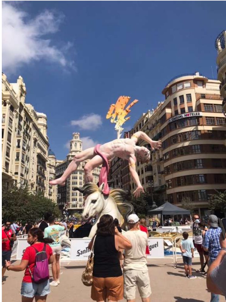
圖 5 市政廣場的法雅人偶