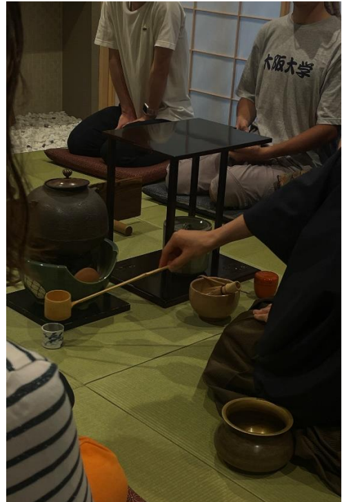
圖二 宿舍舉辦之日本茶道文化體驗