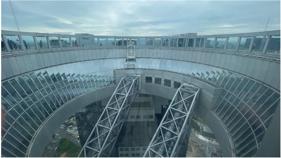
圖六 大阪建築景點參訪