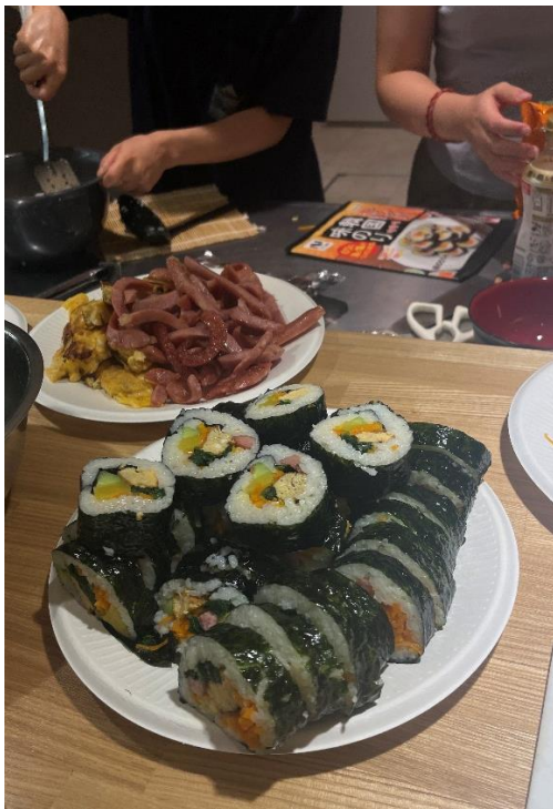
圖一 與韓國交換生一起製作韓國飯捲