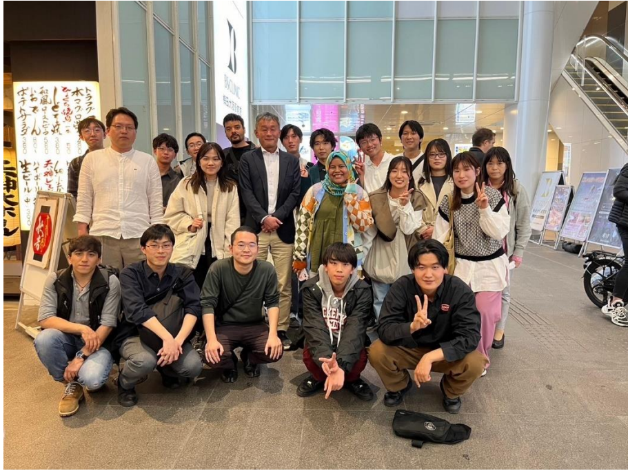
圖四 與交換之研究室聚餐