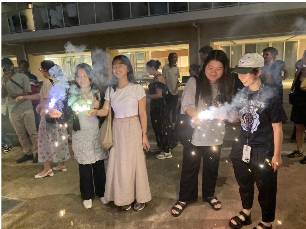
圖三 宿舍舉辦之夏日花火祭典