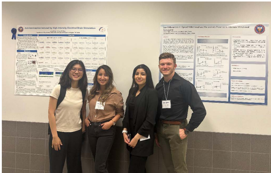
圖二、參加學生學術研究活動