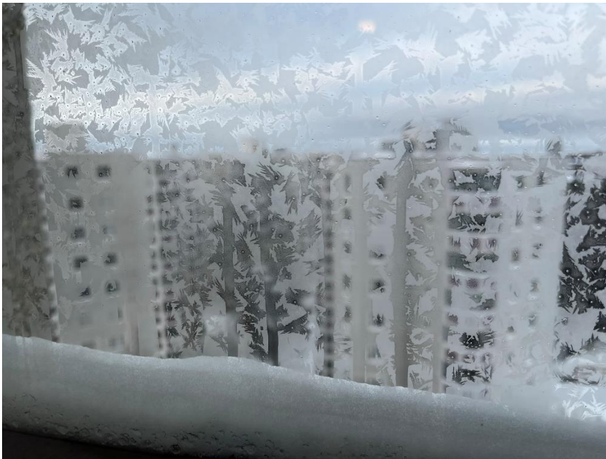
大自然的窗戶裝飾