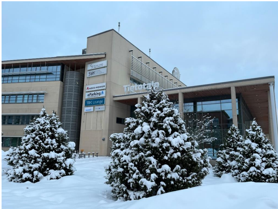
學校系館前天然的聖誕樹