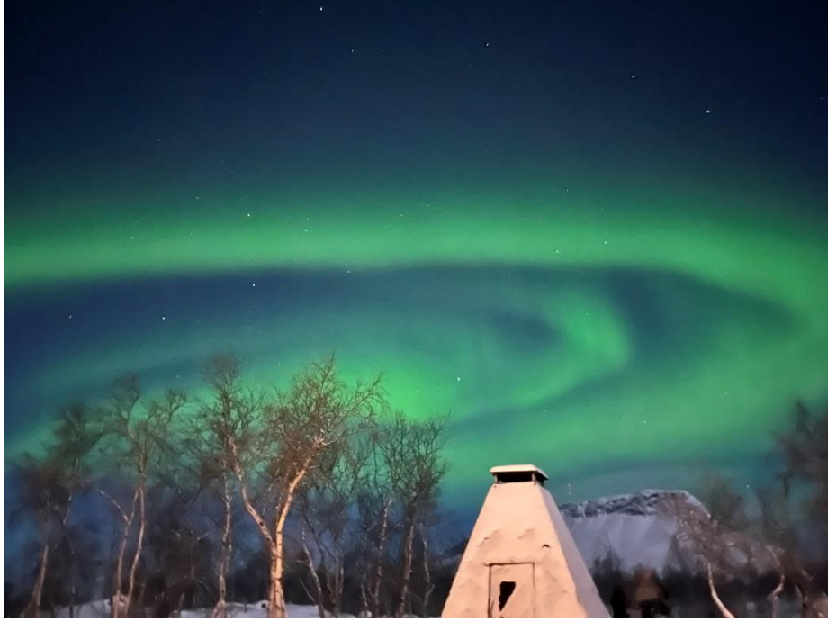
芬蘭 Lapland 的極光