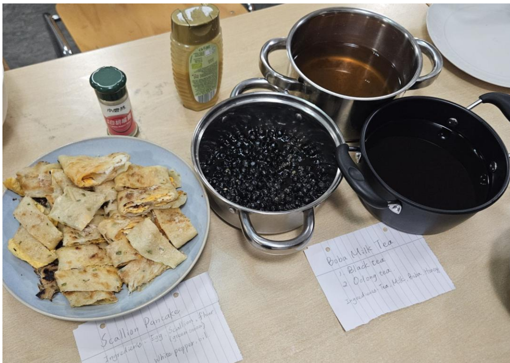
圖二 宿舍 International Dinner 我們準備蔥油餅及珍珠奶茶