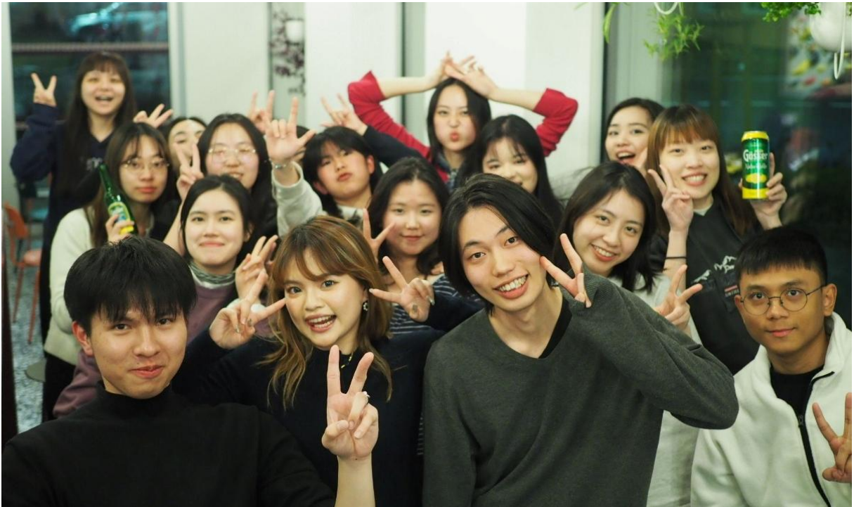
圖五 和朋友們的 Farewell Party