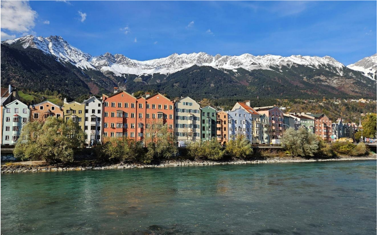
圖一 Innsbruck 河畔彩色屋