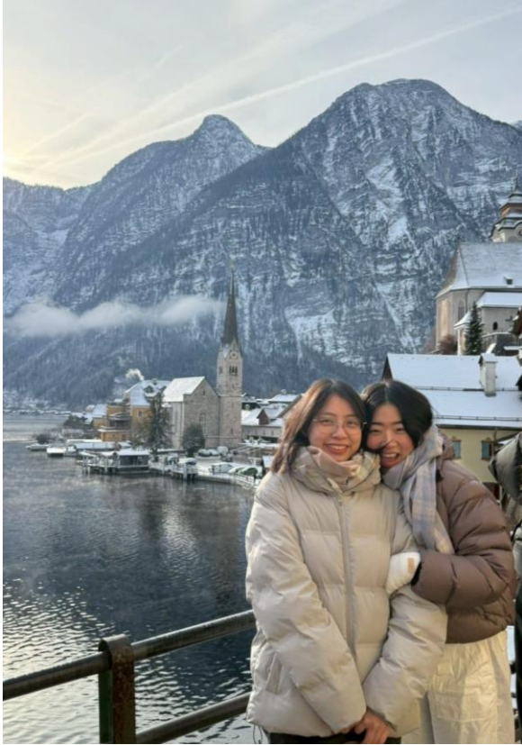
圖三 與最愛的室友遊 Hallstatt