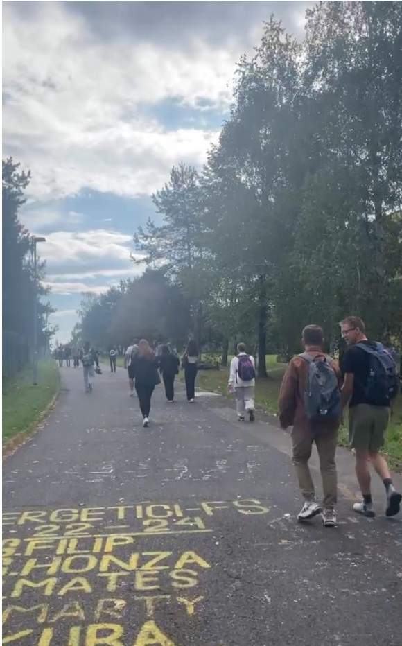
從宿舍到系館的必經之路