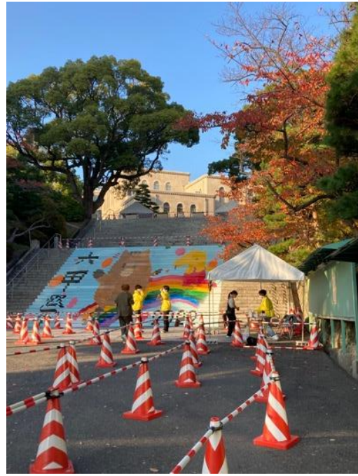
神戶大學學園祭「六甲祭」