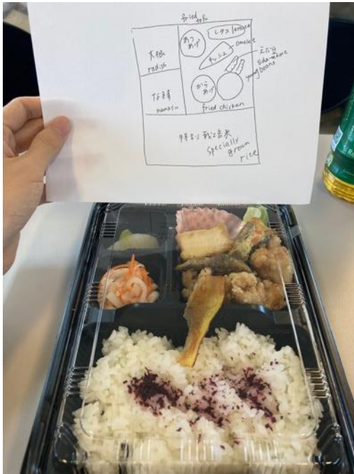
丹波篠山校外教學農學部種植的