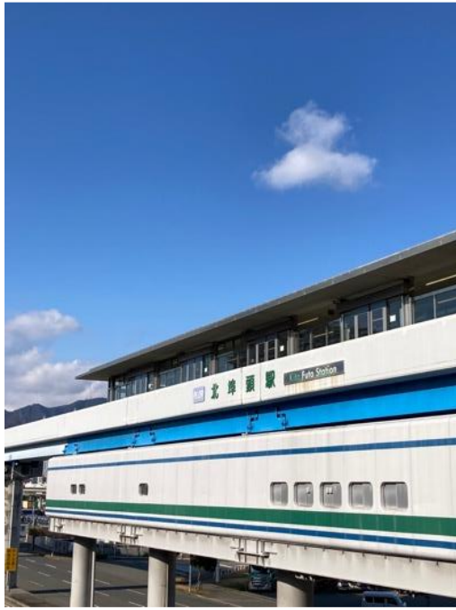
宿舍旁最近的車站