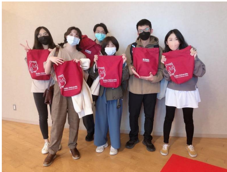
和其他留學生參加神戶大學 GEC 舉辦的世界遊戲大會