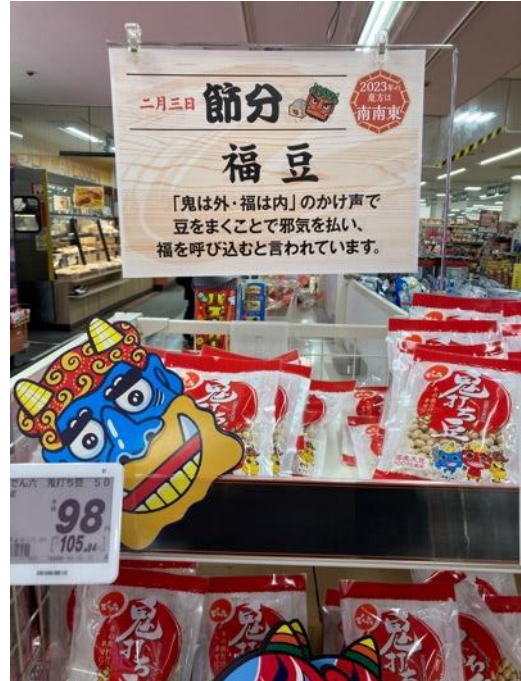
節分時超市裡的飲食文化