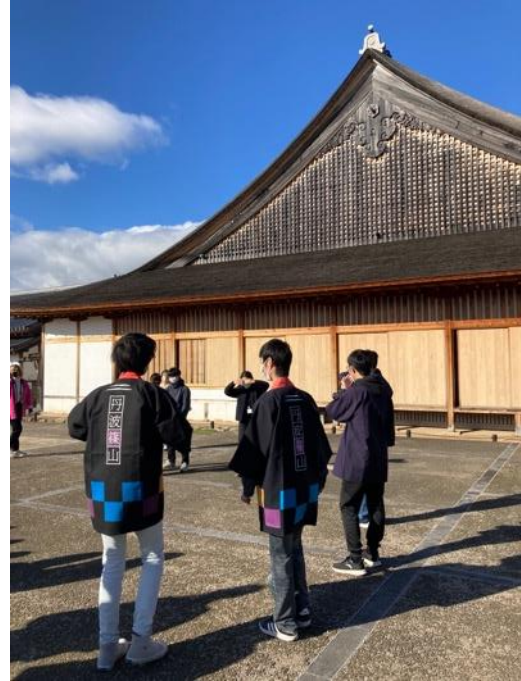
丹波篠山跳傳統舞蹈