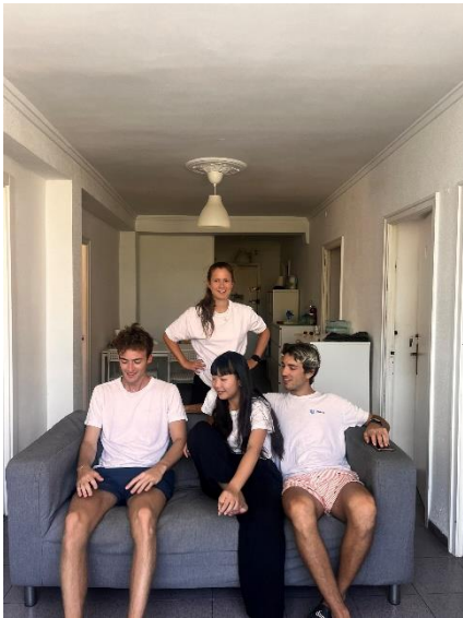
好笑又可愛的室友們