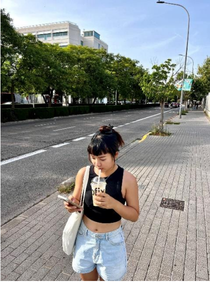
學校附近與好喝冰咖啡