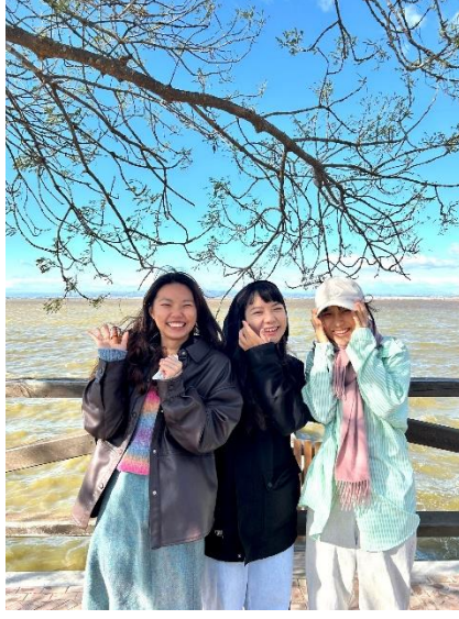
在瓦倫的台灣好朋友