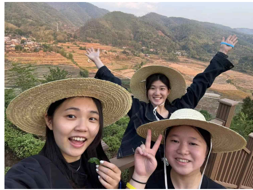
讀懂中國在雲南 茶園