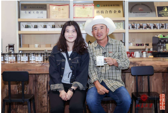
讀懂中國在雲南 愛尼咖啡