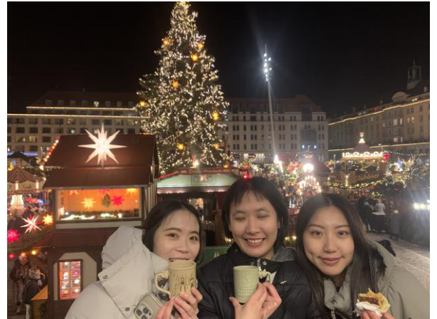
德國 Dresden 聖誕市集