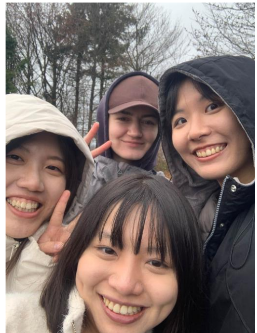
參加 ESN 的健行活動