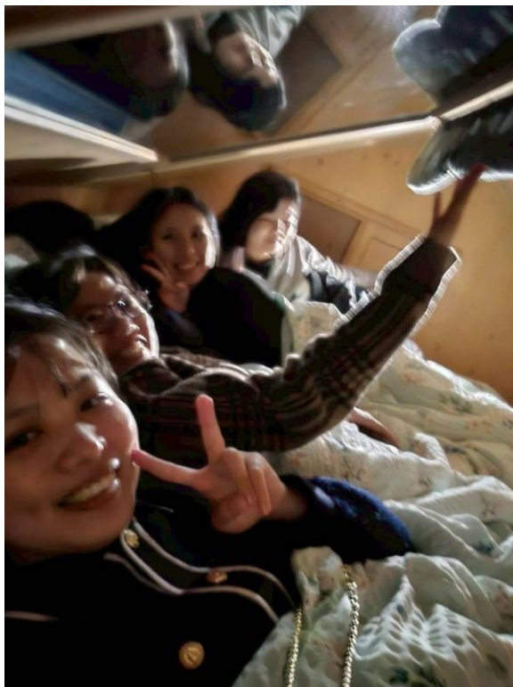
和朋友在捷克自駕旅遊，睡在小木屋