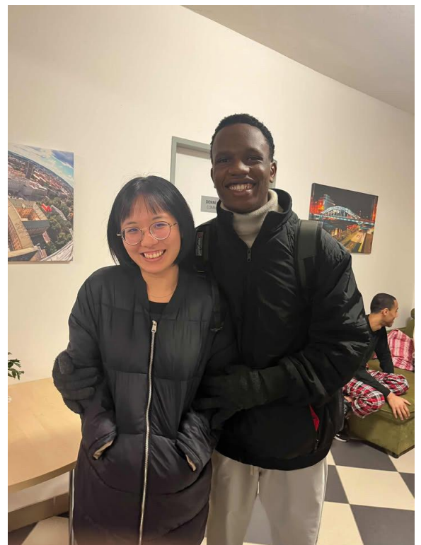
和盧安達朋友告別