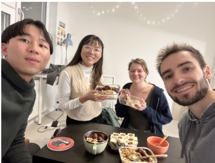
跟外國朋友們分享台灣美食(皮蛋?)