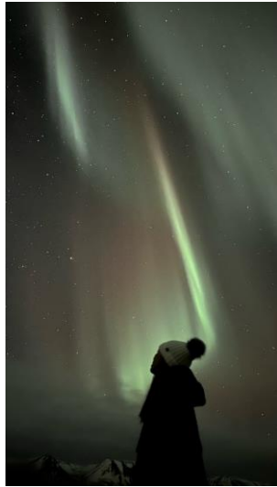
人生一定要看的極光(冰島)