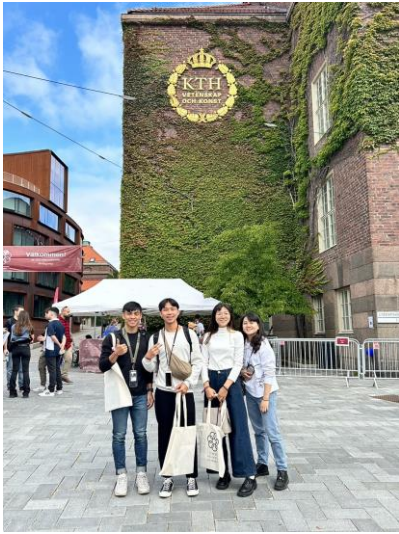
與成大同學們在學校門口的合照