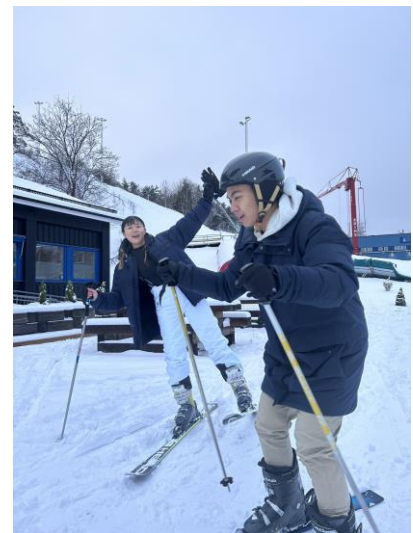
在北歐肯定要滑雪的!