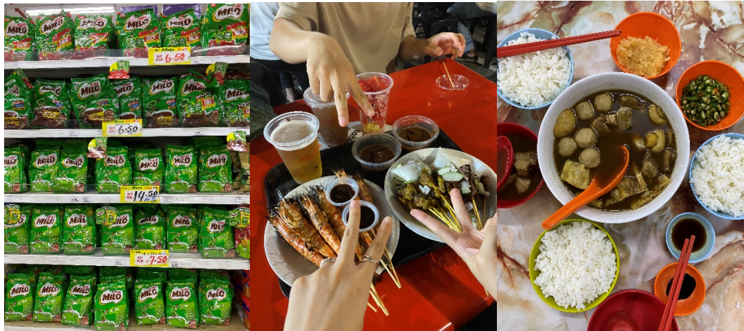
5)美祿:新馬的國民飲料 6) Lat Pat Sa Satay Street 7) 一定要品嘗的肉骨茶 (附圖攝於馬來西亞檳城)