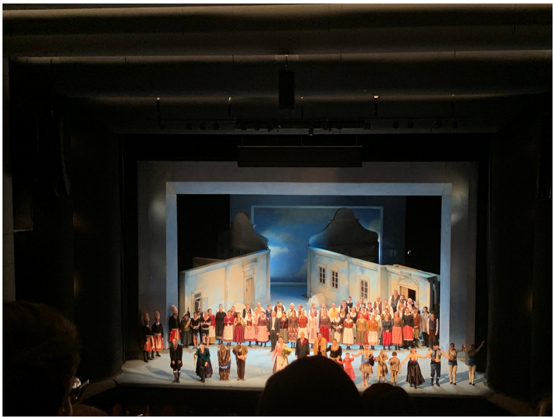
捷克歌劇《被出賣的新娘》