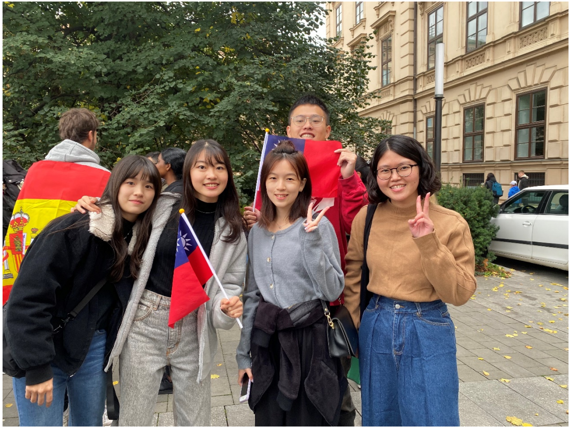
Welcom Week 國旗遊行