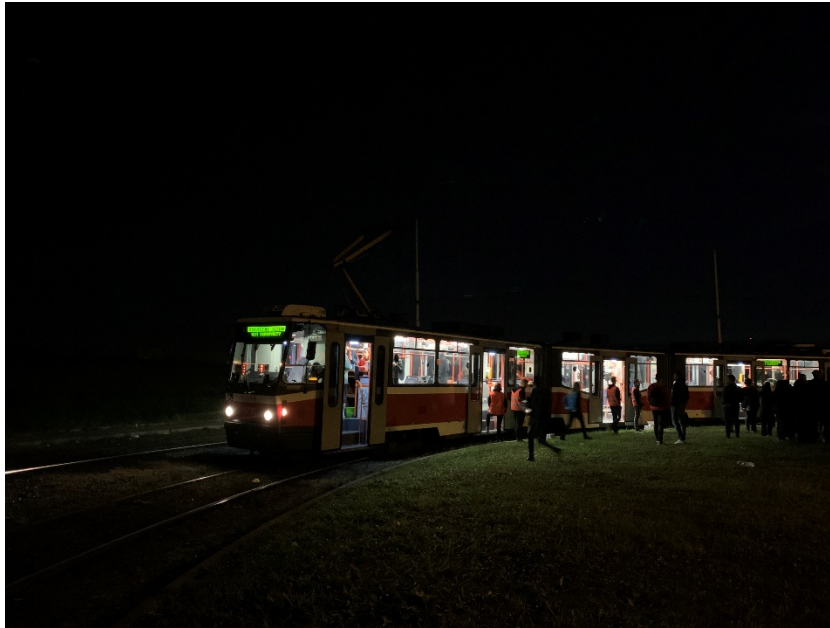
ESN 國際學生會 所舉辦的電車派 對