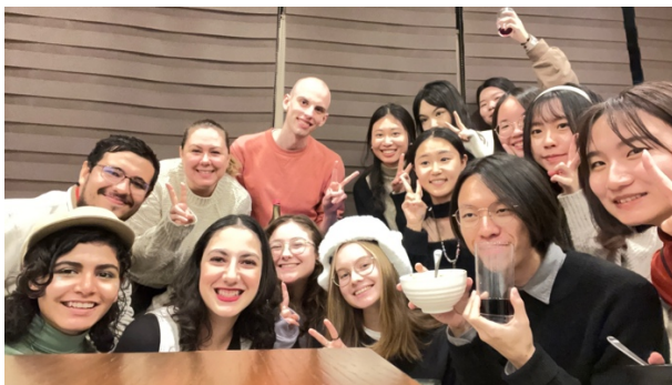
像家人一樣的朋友們（2023/11/17）

千葉大學雖然有很完善的留學生組織，以及留學生支援系統，我們有一部份的留學生仍然想要組織一些具有節日氛圍的聚會，因此我們自行召集了墨西哥、德國、俄羅斯、瑞典、中國，當然還有台灣的留學學生，舉辦兩場留學生聚會。第一場聚會我們租下一間有廚房的空間，自備各國料理；第二場我們體驗日本人過聖誕節的方式：肯德基炸雞。透過這兩場活動，我們除了認識各國料理之外，也體驗了日本的過節方式，能夠和一群同在異國他鄉的朋友一起度過重要的日子，我認為這是很難能可貴的體驗。