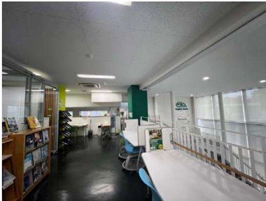
English House 和語言學習的空間

2. 英語：除了日語之外，我認為千葉大學最令我驚豔，或是說覺得受用的設施，是 English House 給我的啟發。這是一個可以練習英語對話的開放式空間，主要會來拜訪 English House 的群體是：國際學生、喜歡且想要練習英文的日本學生。在這裡，我可以提供日本學生一些英文上的協助，日本學生也可以告訴我一些關於日本的知識，我們可以更輕鬆地在裡面找到對話的夥伴。除此之外，English House 還主辦名為 LEX Program 的語言交換計畫，我和一位日本同學一起報名了為期十週的語言交換，我很開心可以提供一些中文的協助，也分享了一些關於台灣特有的文化和時事，例如：台灣的文學和電影、台灣的選舉文化。