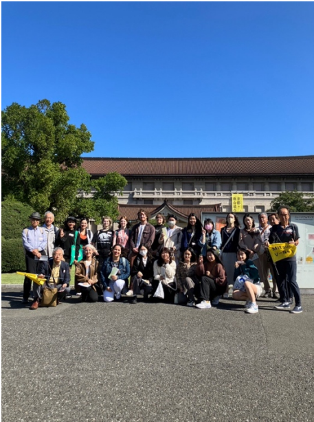
和志工爺爺們、留學生合照(2023/10/07)

剛到日本沒多久，就遇到上野的東京國立博物館的「留學生の日」，也就是留學生可以免門票費入內參觀的日子。千葉大學開放留學生報名團體導覽的活動，那天我們跟著千葉地方的志工爺爺們一起逛博物館。雖然語言理解上有一些難度，但是在其中一場展覽當中，可以跟一位志工爺爺討論日本佛經的書寫，是我沒有預期到的有趣經歷！從西元八世紀開始，「写經」也就是抄經，跟隨著佛教文化，以漢字的形式輸入日本，一開始全漢字書寫的佛經，漸漸隨時間演變發展出各種形式，漢字的形式也和起源地中國有著截然不同的演化。東京國立博物館很大，我們還沒來得及逛完所有展覽，就與志工爺爺們道別。