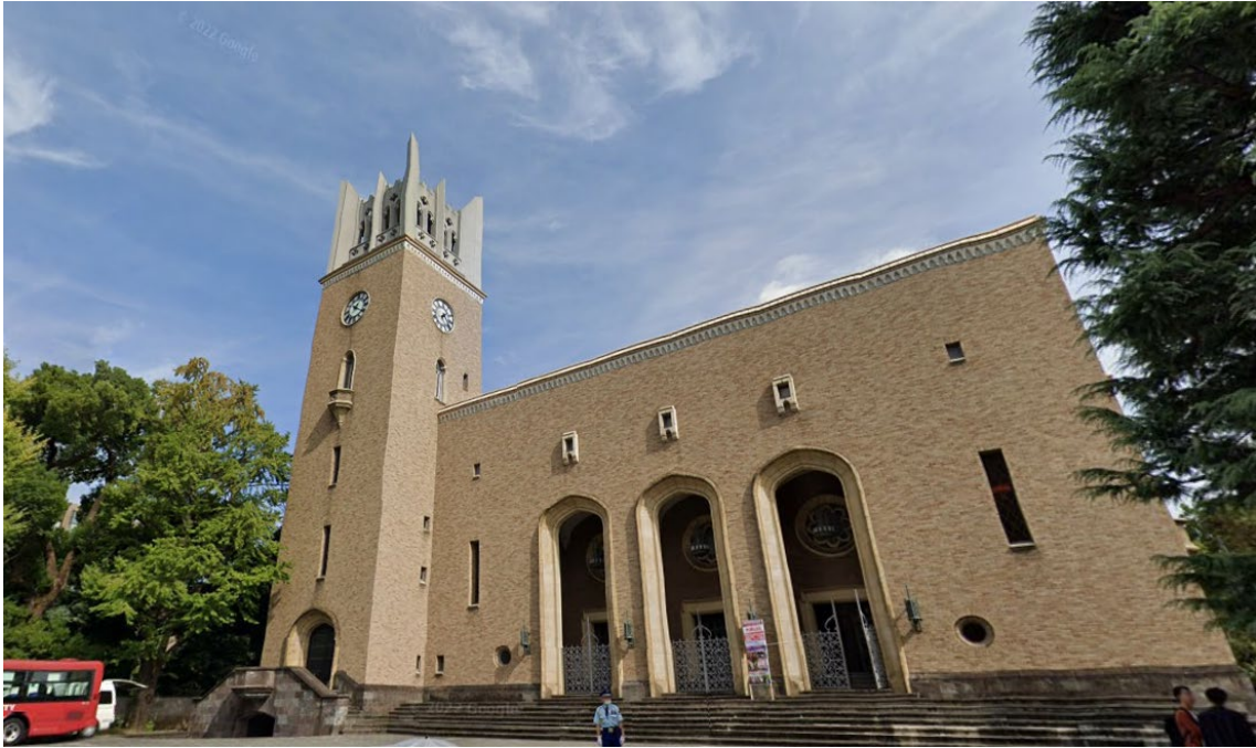
大隈講堂。可以說是早稻田大學最著名的建築之一。