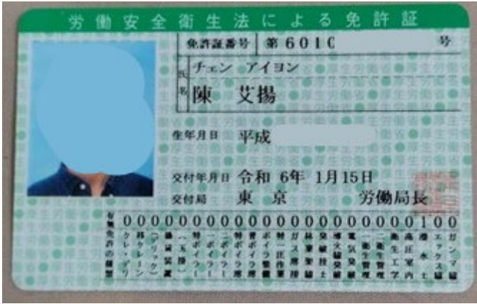
國家考試：潛水士 不須執業經驗，是國高中生都會考的人氣證照。