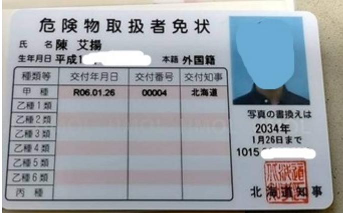
國家考試：甲種危險物使用者 做研究難免會碰到一些管制物質，先考到不虧。