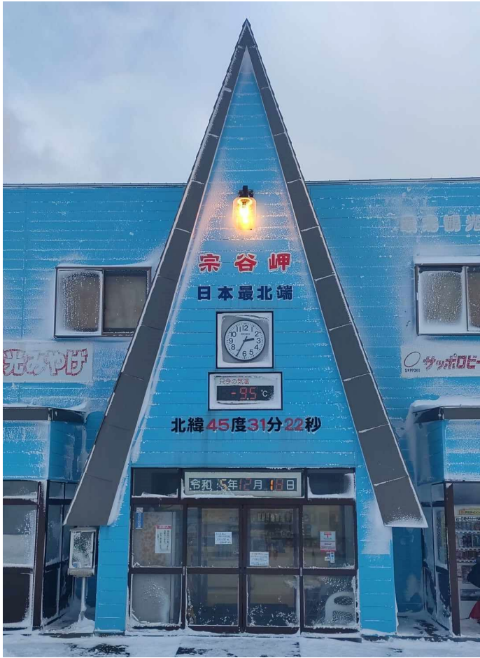
宗谷岬 日本最北端之地。冷。