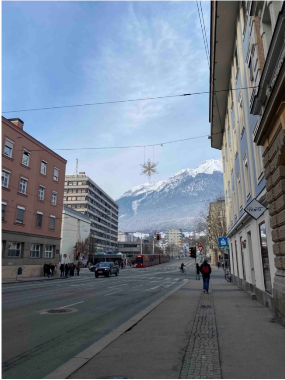
坐擁壯麗山景的學校