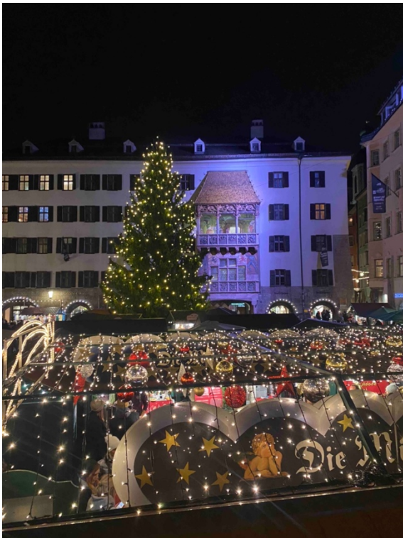
因斯布魯克的聖誕市集