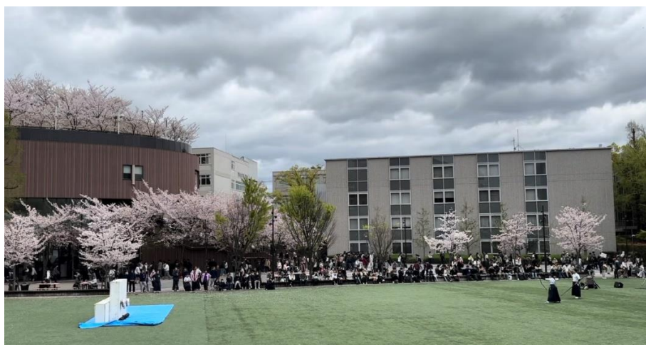
圖 1、關西大學校園 (弓道社表演)