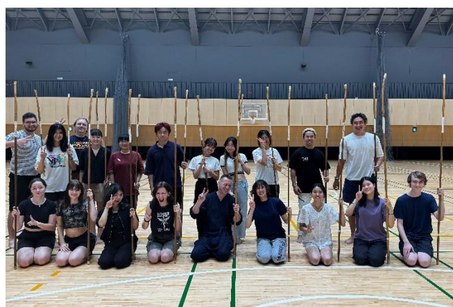
圖 4、薙刀課後大合照