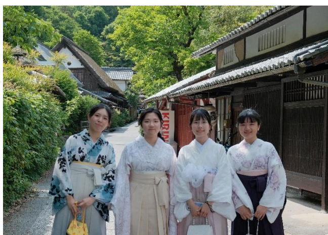
圖 2、京都嵐山體驗和服