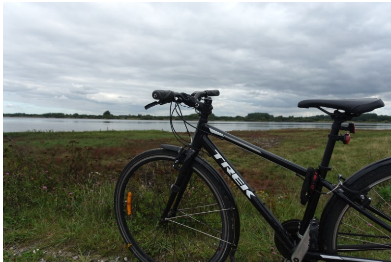
丹麥生活的最佳夥伴