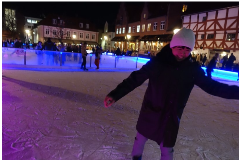
市中心免費的滑冰場