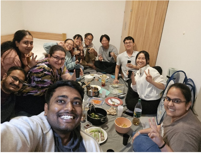
國際學生辦食物交流餐會