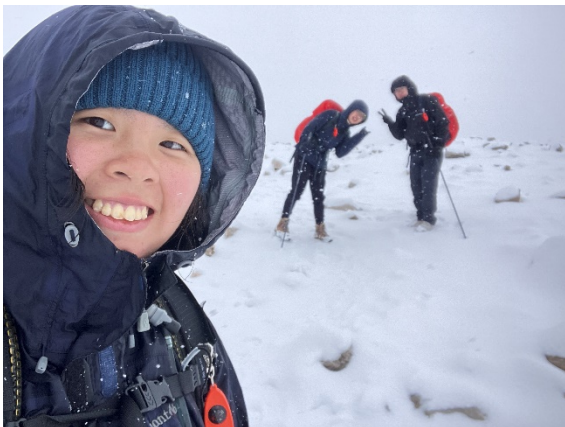
接近山頂已經是一片雪景