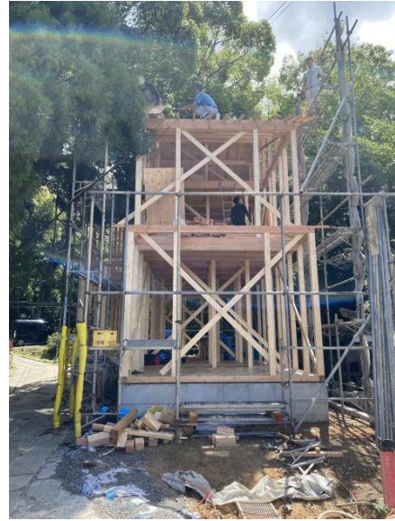
木造建築的學習機會相當多