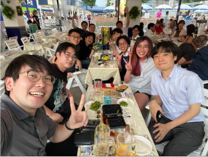
與研究室成員在啤酒節聚餐