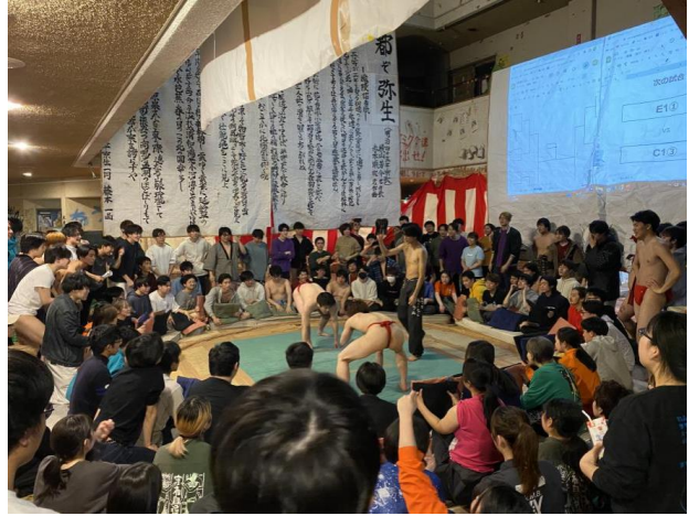
惠迪寮宿舍有一些傳統活動，如相撲