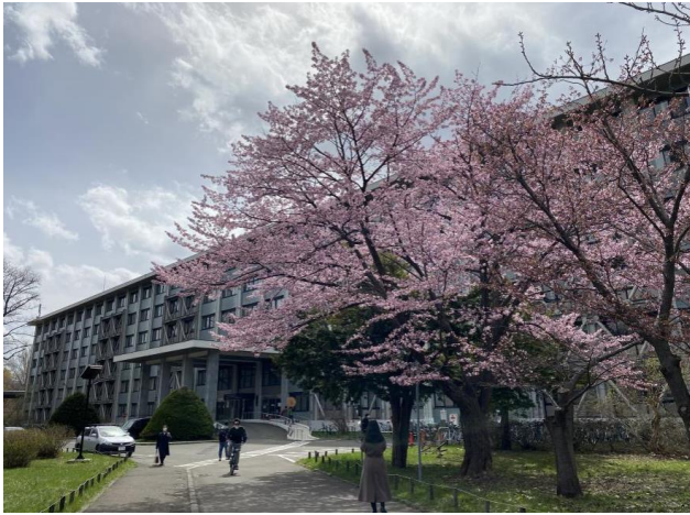
北海道大學工學院外觀