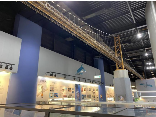
神戶明石海峽大橋旁的橋樑科學館學習