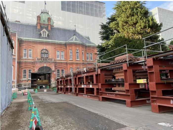
跟研究室成員到當地著名古蹟之修復工地參訪