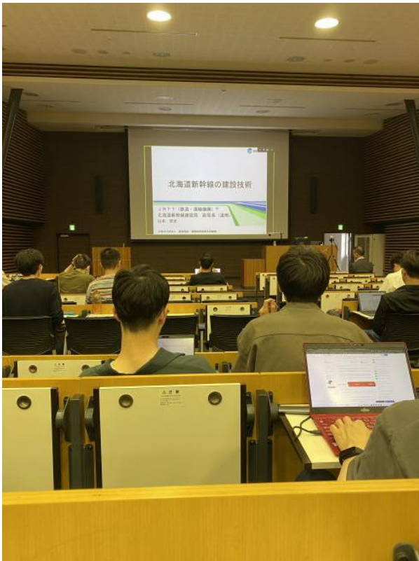
工學院常會有演講，北海道新幹線建設十分有趣的工程經驗分享