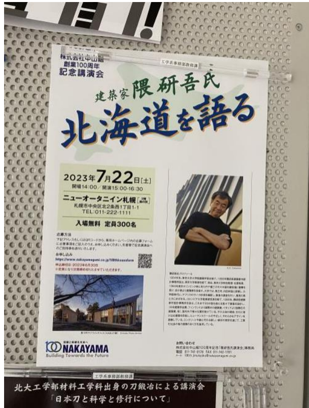
工學院的佈告欄 知名建築師到北海道演講，很精彩