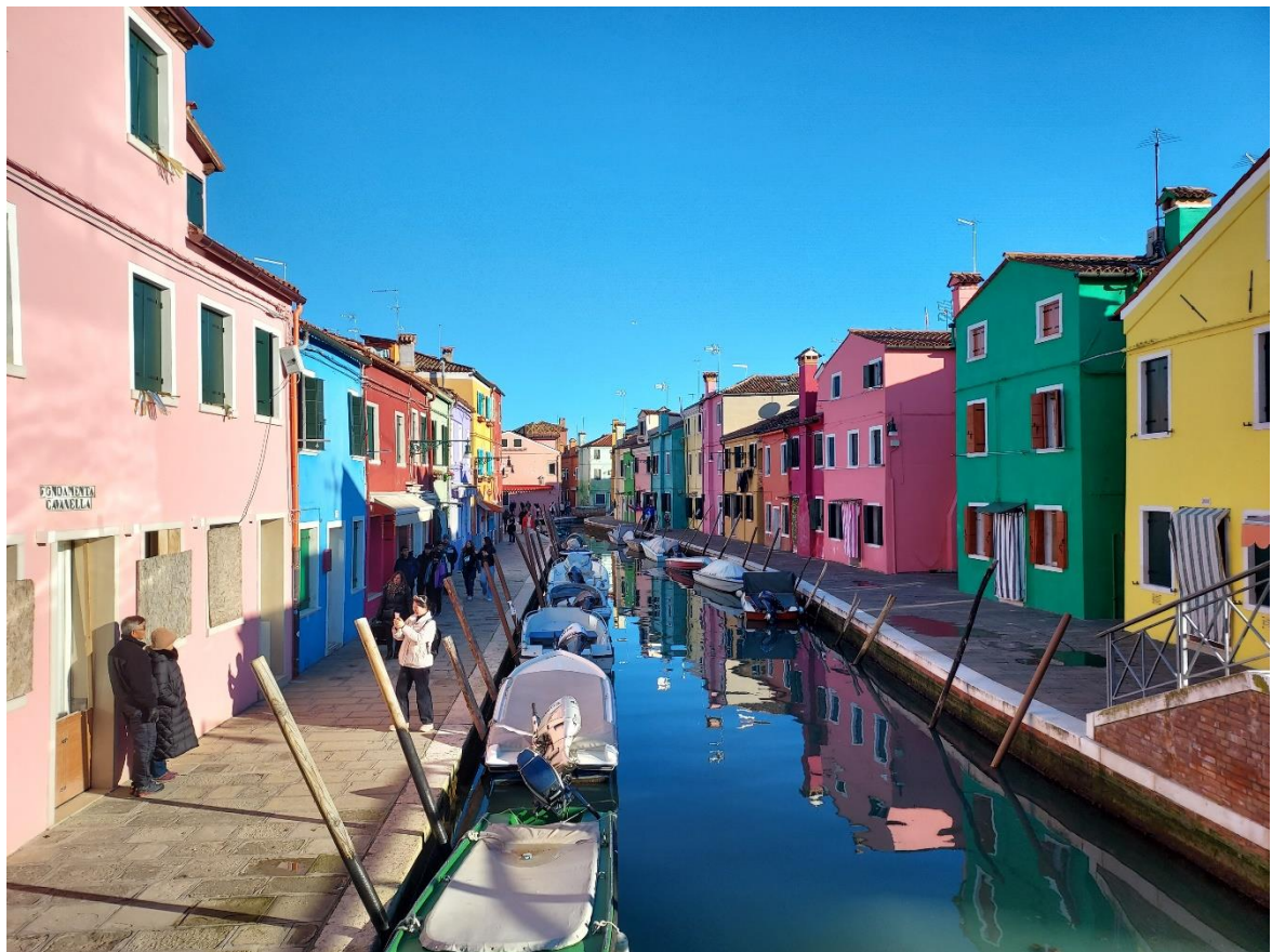
圖 十：義大利威尼斯彩虹島