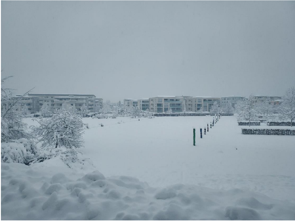
圖 五：十一月底德國慕尼黑暴風雪的景色