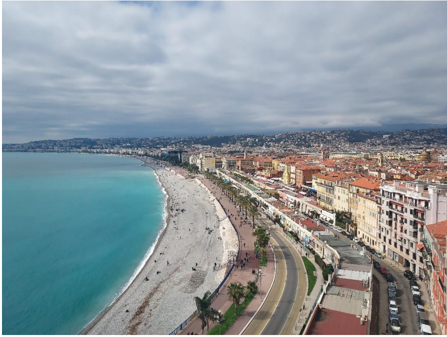
圖 十三：南法尼斯景色