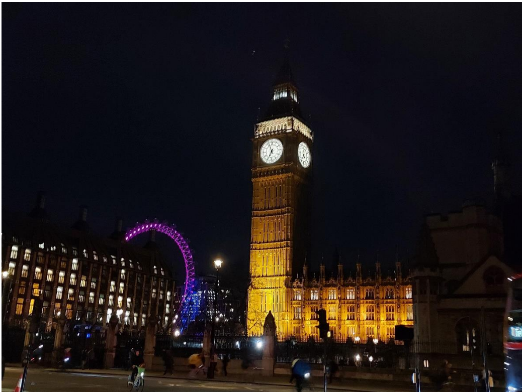
圖 十二：英國倫敦大笨鐘與倫敦之眼