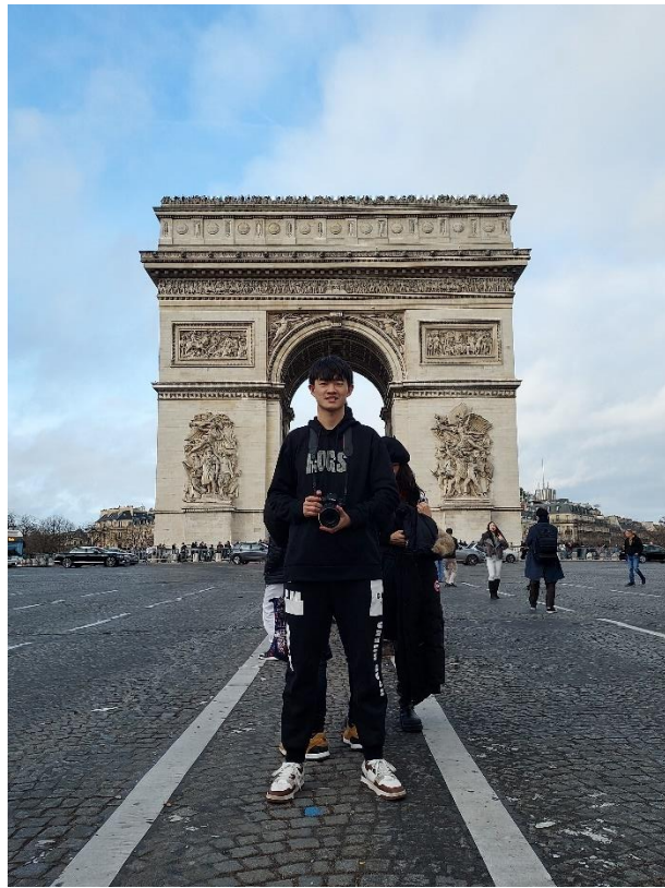
圖 九：法國巴黎凱旋門