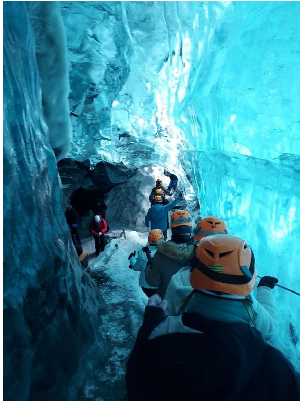
圖 十一：冰島冰洞探險