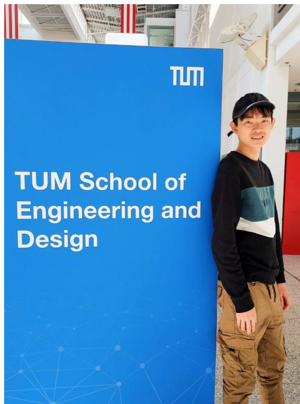
圖 二：工程設計學院