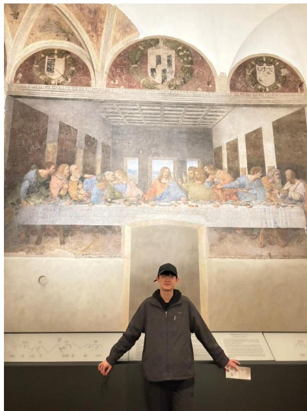
圖 四：義大利米蘭之旅—《最後的晚餐》