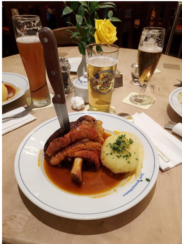
圖 三：德國南方豬腳