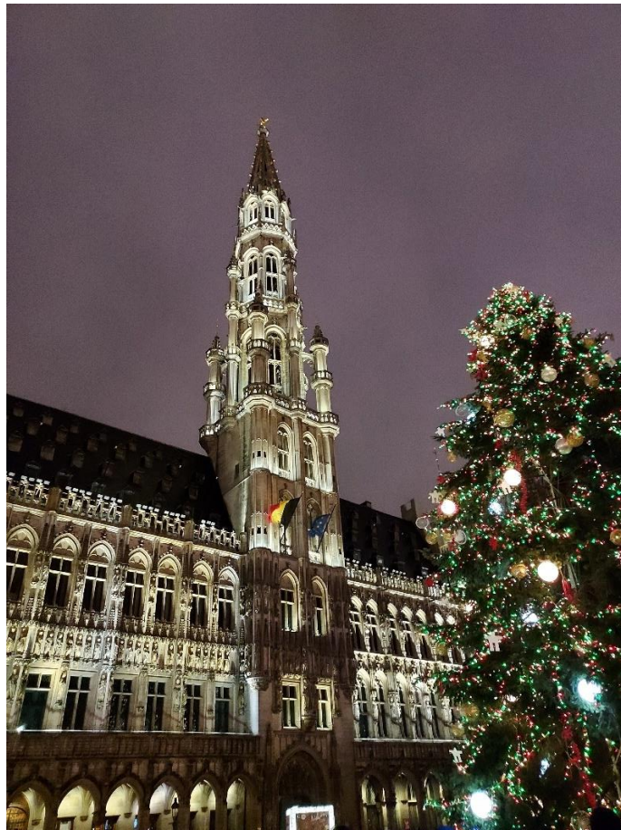
圖 七：比利時布魯塞爾舊市政廳