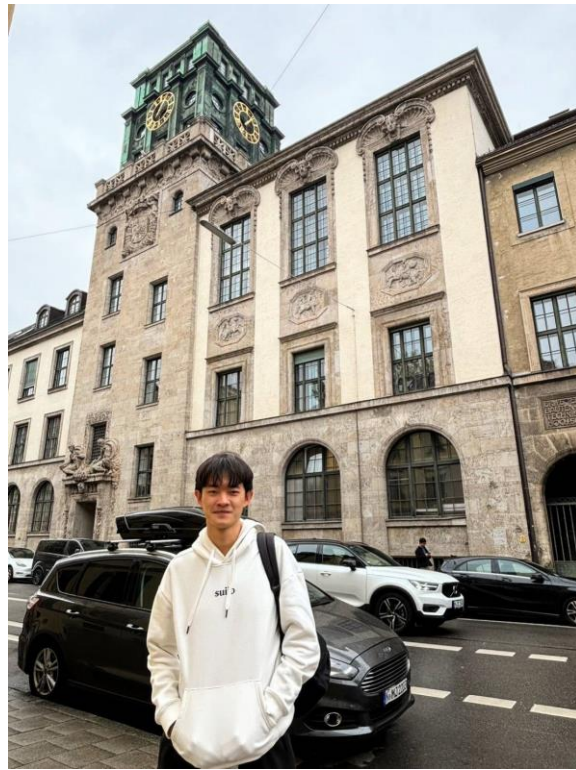
圖 一：慕尼黑工業大學鐘樓