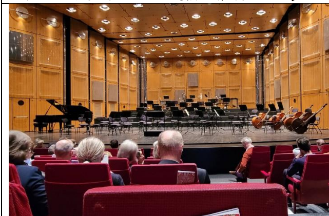
圖 四-5 達姆歌劇院