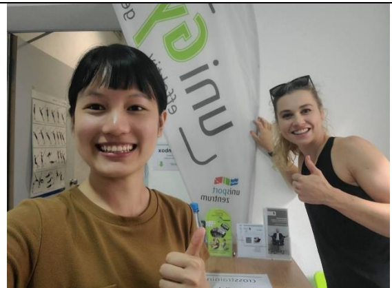
圖 四-4 美麗大方的體育老師