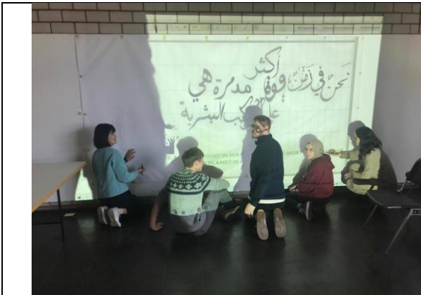
圖 四-1 難忘和德國同學一起畫畫的時光