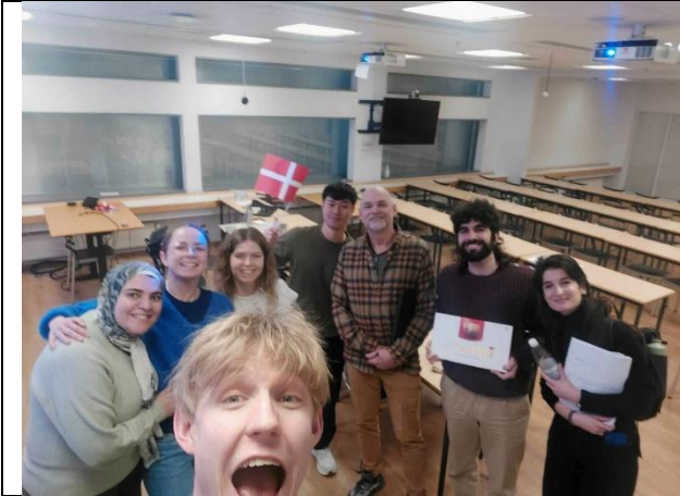
期末口試完的大合照