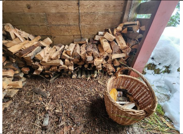
組員的 summer house 跟劈材體驗