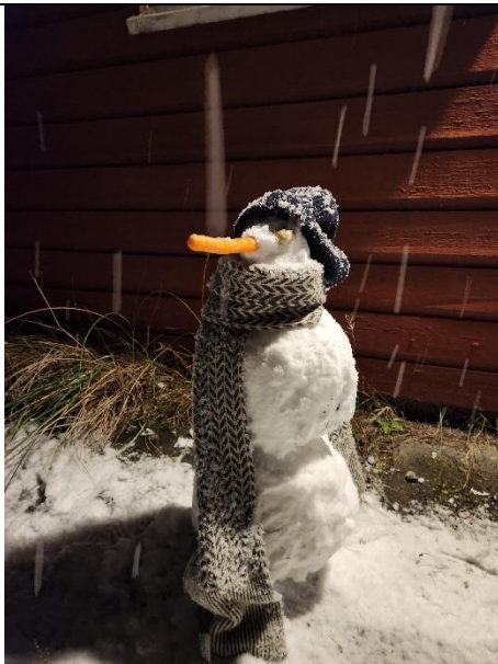
人生初雪和第一個雪人