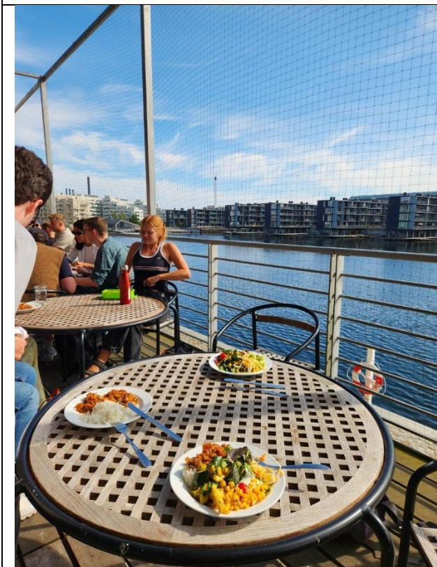
學校餐廳戶外用餐區