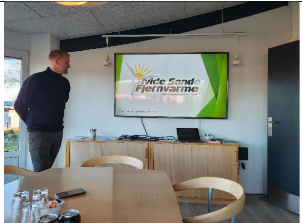
區域供暖公司訪談