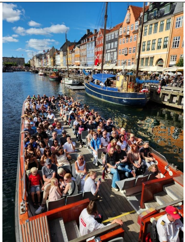
哥本哈根代表性景點：新港