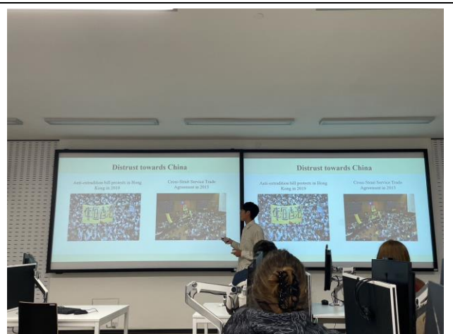
課程結尾的分組報告(很緊張)