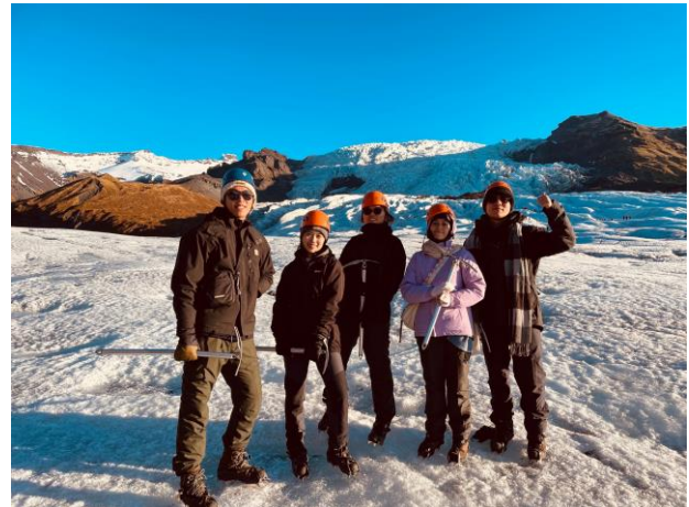
在冰島自駕的冰川之旅