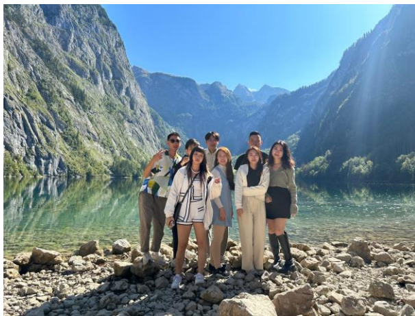
自駕去德國國王湖的旅行