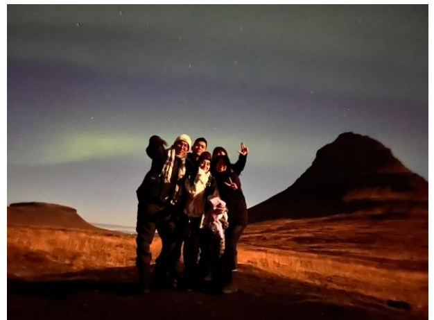
驚喜的看到人生第一場極光