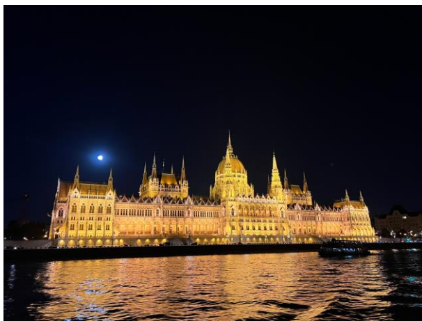
在布達佩斯搭遊船的夜景照