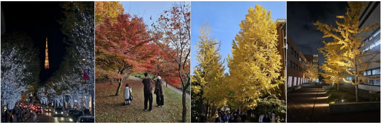
由左至右分別是：著名的六本木點燈、與台灣及中國同學一同賞楓、校園內銀杏之日景與夜景。日本的校園與行道樹非常多的銀杏，一入秋便充滿黃色。