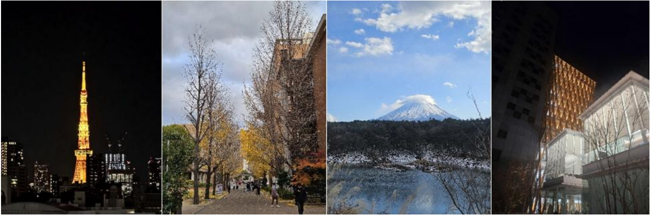
由左至右分別是：東京鐵塔夜景、校園殘留銀杏、富士山、最後一次看校園夜景。此富士山是由精進湖方向拍攝，又稱「抱子富士」；而配合山頂的雲則是被稱為笠富士的景觀。