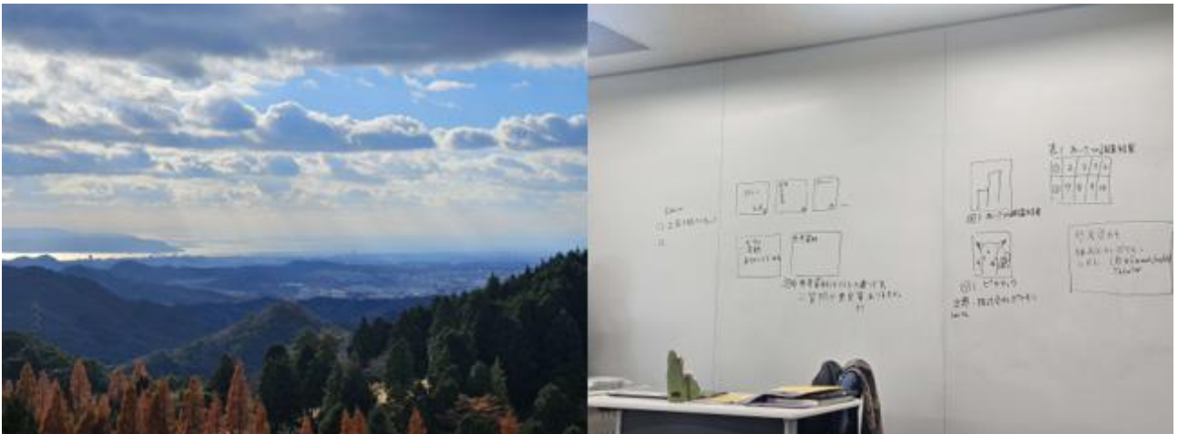
圖左為前往兵庫縣六甲山散心時所攝，遠眺明石海峽與從雲隙糝落大地之陽光構成之美景；右為老師講解期末上台報告之重點整理，期末報告算是十分正式的環節，我介紹的主題為：台日政治體制的差異。