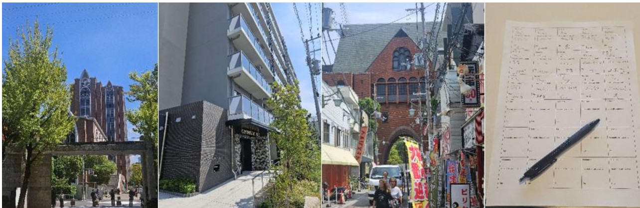
由左至右分別是：大學校園一隅、宿舍、學校大門、開學團康活動紀錄。