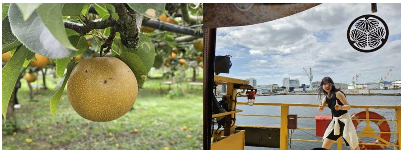
圖左為去滋賀體驗採摘梨子，圖右為神戶港與要好的韓國同學。