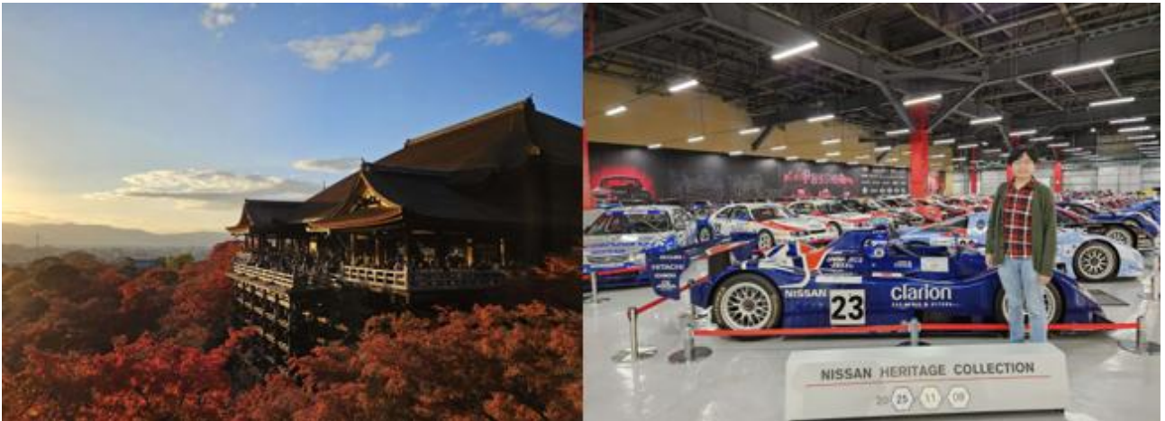
圖左為清水寺楓葉景觀，圖右為前往神奈川縣座間市日產座間事務所二區之 Nissan Heritage Collection 參觀留影。