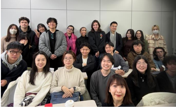
一起上同一門日文課的同學們