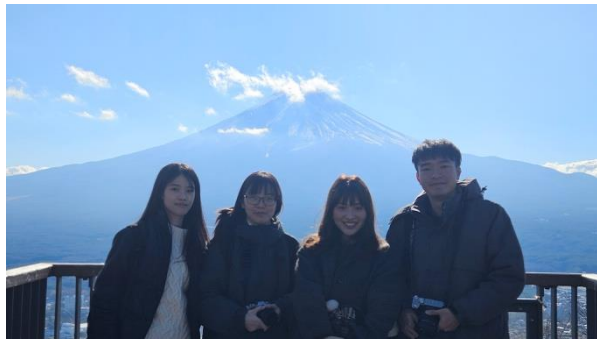
造訪河口湖、富士山