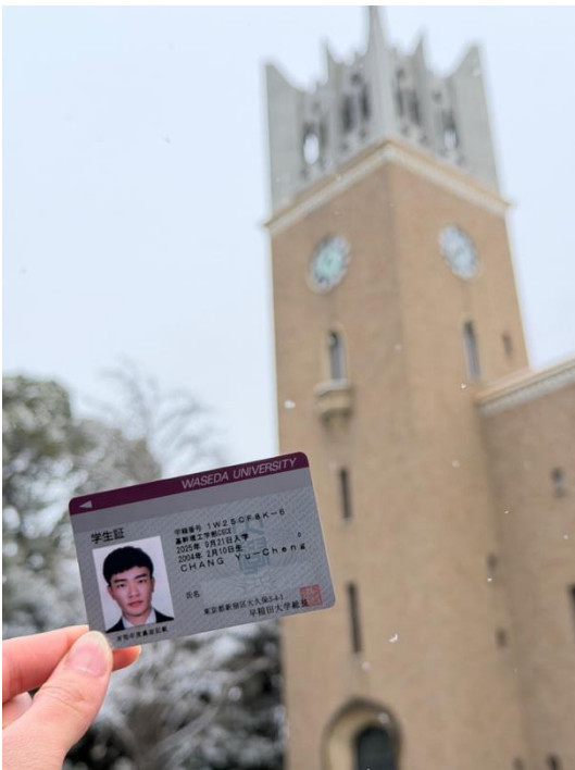
學生證和早稻田的大隈講堂合照 (離開前的最後一天東京才下雪，剛好拍下這張照片)