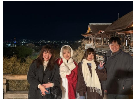
過年到清水寺體驗夜間敲鐘