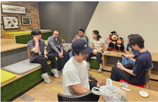
在宿舍的 lounge 練習用日文聊天