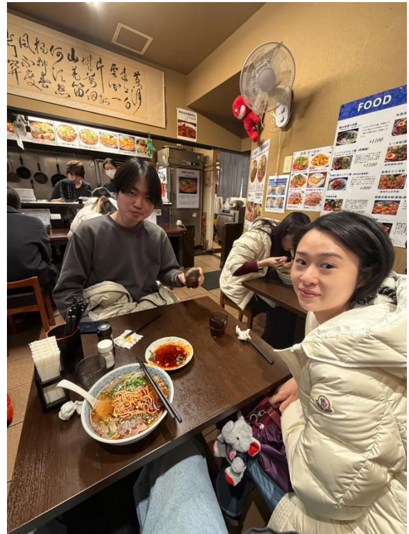
帶夏威夷朋友體驗牛肉麵