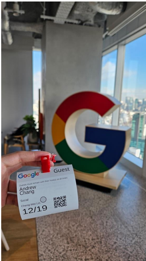
參訪東京 Google 總部