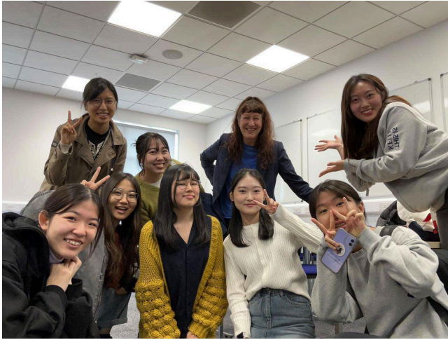
英文課與其他交換生之合影