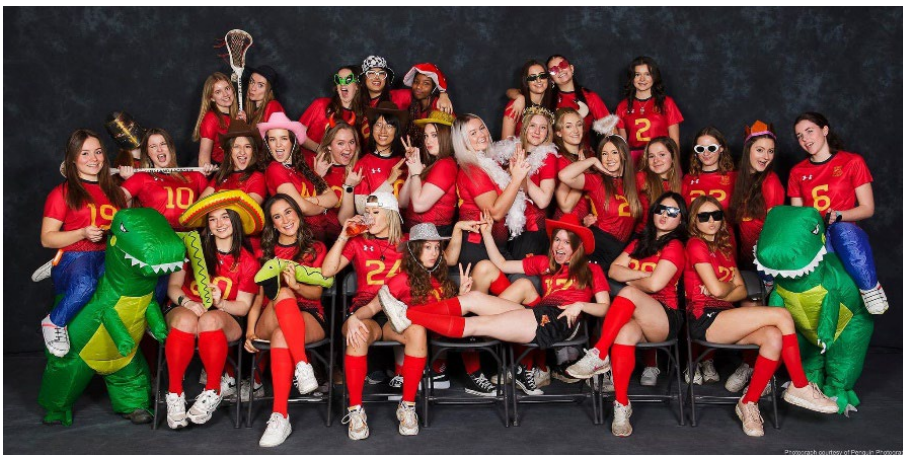
Lacrosse 社團成員合影紀念