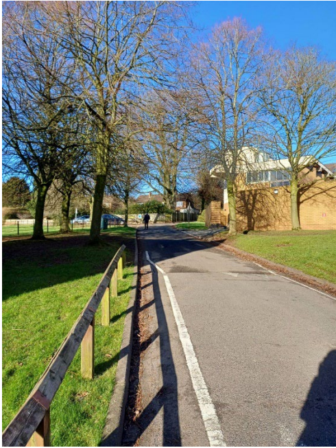
宿舍門口上學必經之路