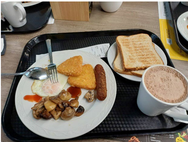
學生餐廳經濟實惠的早餐