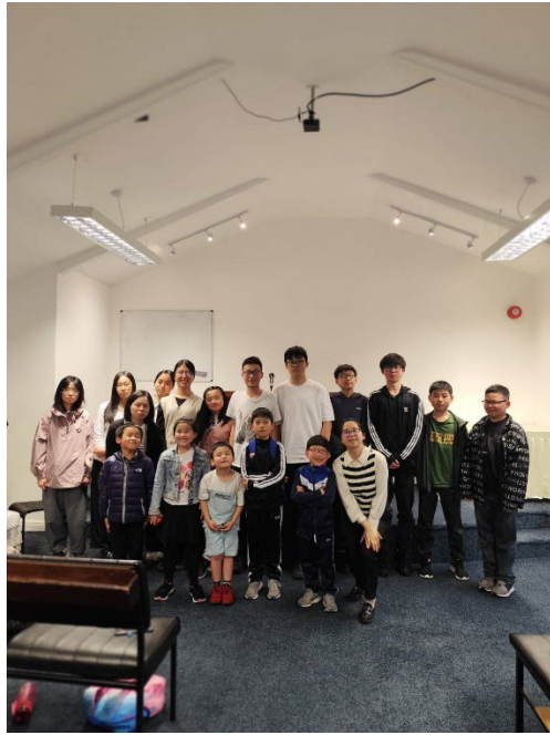
真耶穌教會伯明罕教會與孩子合影