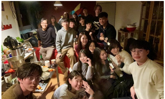
Figure 3.6 慕尼黑各種團建吃飯合照

另外這也是第一次二月中旬的時候沒有在台灣過年，過年我們聚集了一批台灣夥伴一起辦了一個圍爐派對，大家暢聊這半年的點點滴滴，並且吃了一頓非常豐盛的大餐，雖然沒辦法跟家人團聚還是會有些落寞，但是跟朋友們聚在一塊也是別有一番滋味，為這個寒冷的歐洲冬日增添了不少溫度。