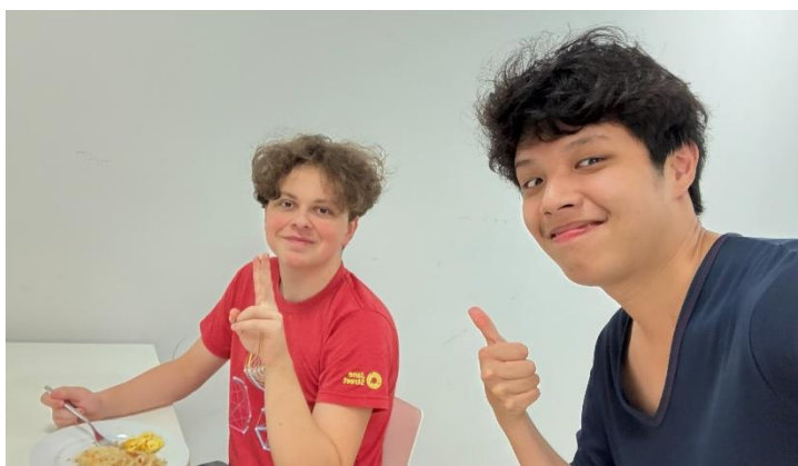
Figure 5.1 第3.7節提到的慕尼黑溜冰、珍珠奶茶分享會、英國花園野餐、為外國朋友做飯