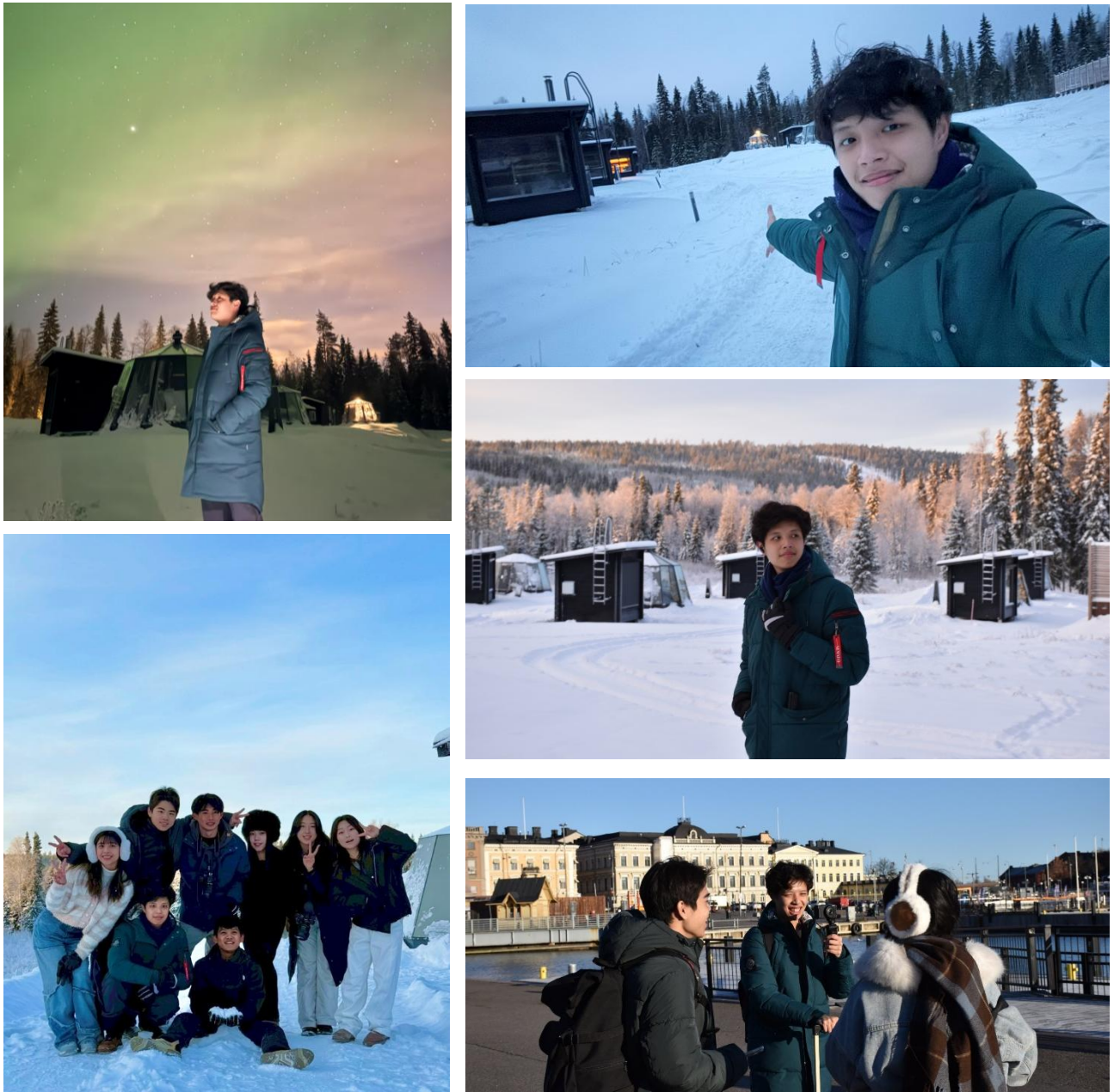
Figure 4.4 芬蘭羅瓦聶米極光村、赫爾辛基港口

認為這種是因為太過放鬆才會有的失憶現象，不過我敢肯定那晚大家臉上都掛著笑容。大約晚上十點，酒吧老闆向我們說道外面好像下雪了...雪，漫漫人生之中只有在書本上才會看到的純白結晶，雪的浪漫本就只能在電影、電視劇上才能領教，此等大自然的奇蹟，竟然...就這麼沒有預兆的發生了。只見八人組直接從酒吧的沙發上彈射起步，衝到了門外，眼前竟是漫漫點點的飛雪，此刻的感動無以言表，當然一群沒看過雪的人們像鄉巴佬一樣肆意亂叫，那是感動的喧囂，那是無法用話語訴說的快樂與悸動。於是那晚，我解鎖了「人生初見白雪」的成就，這份回憶就這樣溫柔的刻進我的內心了～