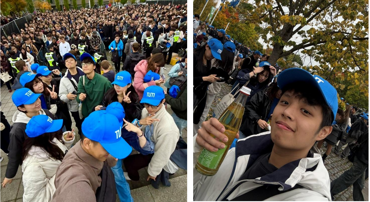
Figure 3.4 TUM Garching 校區開學典禮搶帽子