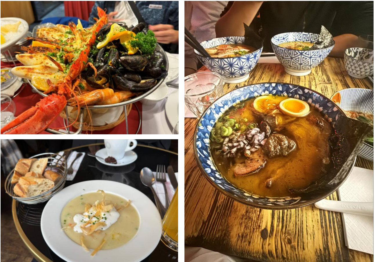
Figure 4.3 巴黎美食(雖然這些都不是法餐)

一週的時間，說長不長，說短不短，我們走遍了巴黎許多大街小巷，凡爾賽宮、羅浮宮、瑪黑區...等。當然也品嚐了許多美味的法餐料理，果然巴黎就是歐洲兩大最強廚房之一，對於我這個大胃饕客來說，無不充滿許多各式美味食物能夠飽餐一頓。我們甚至找到了全歐洲最好吃的日本拉麵，以及一間歐洲最好吃的由台灣老闆經營的台灣料理小店。無不讓人覺得充滿驚喜。當然這些驚喜都早已經讓巴黎在我心中的印象分遠超之前一開始的分數了。