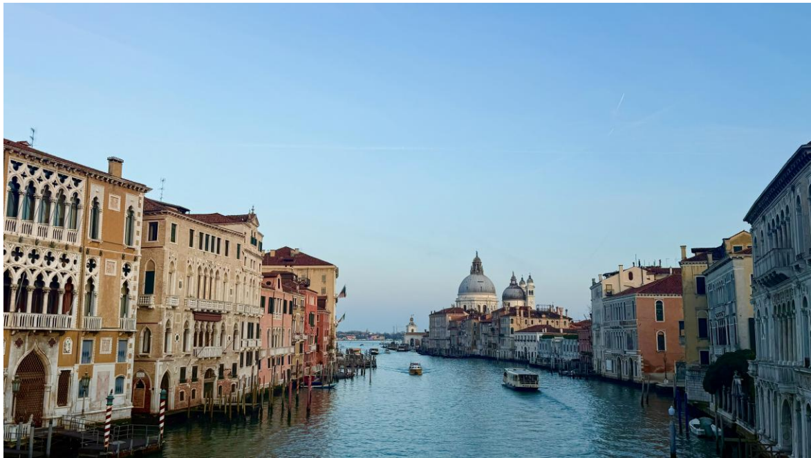
Figure 4.6 義大利之米蘭大教堂、威尼斯、佛羅倫斯米開朗基羅廣場

再來是條條大路都通達的羅馬，這座「永恆之城」是義大利的首都，也是古羅馬文化、文藝復興與巴洛克風貌的大熔爐，可以說整個城市處處都充滿了寶藏，從埋葬了許多義大利偉人的萬神殿，到只要丟了硬幣許願就能在有朝一日回到羅馬的特雷維噴泉，再到上世紀著名電影「羅馬假期」的聖地—納沃納廣場，最後直至羅馬古城的心臟—羅馬競技場，這些都無不刻畫與紀錄了西元前豐沛的古羅馬歷史故事。另外，2025年也是梵蒂岡聖門開門的一年，因此我們當然也沒錯過這個機會，造訪了梵諦岡那金碧輝煌的神聖大教堂，與在歐洲任何教