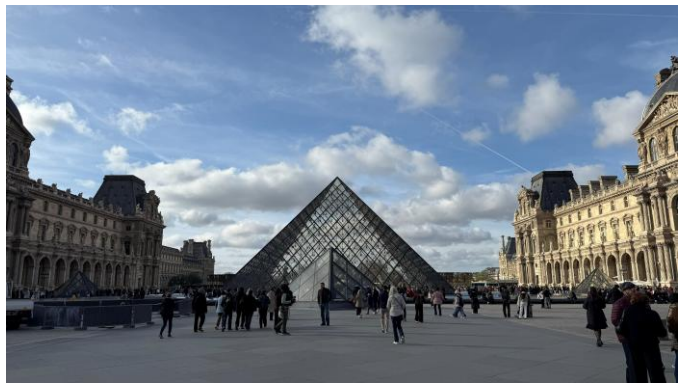
Figure 4.2 巴黎艾菲爾鐵塔、羅浮宮

但此刻的巴黎並未展露它真正的美，巴黎的夜晚才是一切的精華，旅程的後三天，我每天下午都會從聖母院一帶漫步兩個小時走到巴黎艾菲爾鐵塔，抵達的當下夕陽也落下的差不多了，因此我喜歡選個河畔邊的橋下，找個人比較少的地方靜靜的欣賞那每到夕陽落下後，發出璀璨光芒的艾菲爾鐵塔。我依舊記得來到巴黎第一個晚上看到凱旋門與鐵塔的瞬間，真的很令人動容，夜晚之中巴黎各處的街區也會共同亮起金黃色的燈光，一切的一切好像都在妝點艾菲爾鐵塔，令其在周圍優美建築的夜燈點綴下變得更加美麗動人。當下完全不曾想過