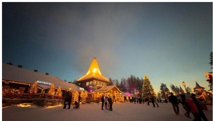
Figure 4.5 芬蘭北極聖誕老人村

北極之旅的短短五天，一路上，我們當然也沒放過聖誕老人村，搭了馴鹿跟哈士奇雪橇，也在北緯66.5度的北極線上拍了照片，住了我在歐洲住過最乾淨舒適、設備及用品最健全的B&B，也品嚐了最美味的奶油鮭魚湯，一切的一切都那麼的歷歷在目。雖然臥鋪火車與破冰船的部分還是沒能體驗到，但是我的內心早已甚是感激，感激為我們安排所有行程的 Ariel、Melody 兩位女士，以及拉了我一把的 Fish 哥，還有小藍、小馬、Jenny 這些旅程中不可或缺的好旅伴，讓我完成了所謂的「補完計畫」。要說這趟夢幻之旅學會了什麼，大概就是...人果然還是要多多靜下心來，聆聽自己的聲音，勇敢做自己想做的夢。那天，一隻手把我拖向了北極，但或許如果沒有這樣的機緣巧合，我就不會自己實現這些童年一直做的美夢了吧。於是在那之後，我在交換之旅的下半年，變的比較常自己獨旅，自己追自己的夢，尋找自己需要的快樂，那是與多個朋友同行不同的另一種享受態度，一種更多疼惜自己的態度。每個人都有權利做自己想做的夢，勇敢踏出那一步，即便對你來說，獨旅依舊過於恐怖，那不如