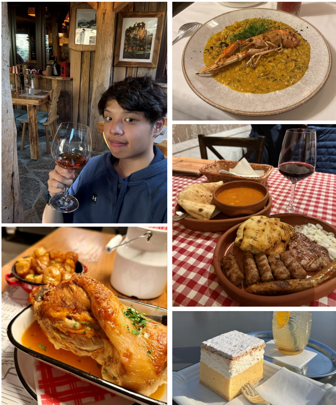
Figure 4.11 斯洛維尼亞美食美酒

市走完了，由於我留給我自己更多的時間，因此更可以悠悠哉哉的散步，一覽當地的著名地標以及人煙罕至的漂亮小巷。若是遇到看起來好吃的餐廳，我就毫不客氣的進去品味一番，也因而收穫不少好吃的美食。