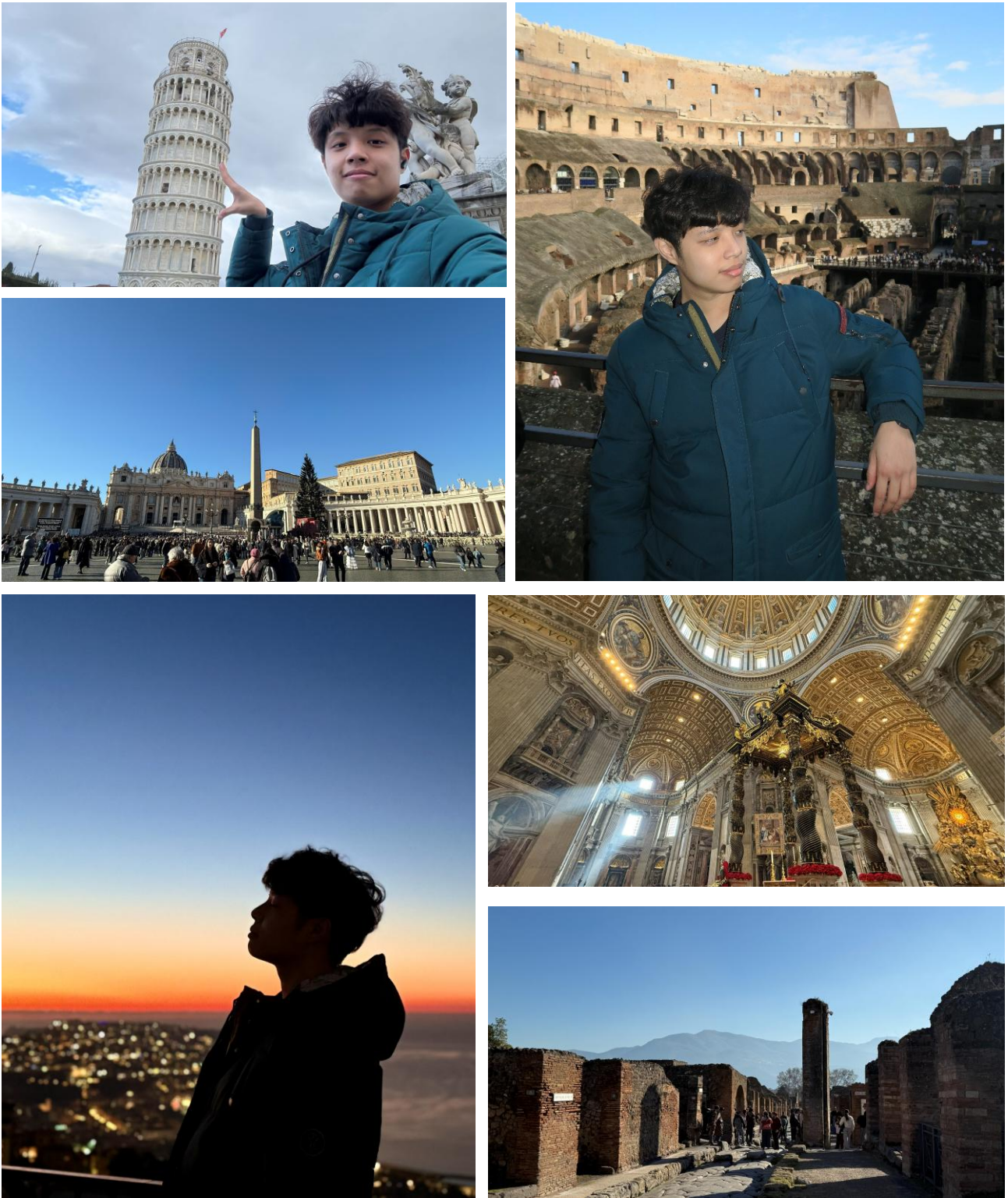
Figure 4.7 義大利之比薩斜塔、羅馬競技場、梵諦岡教堂、那不勒斯聖埃莫堡、龐貝古城

堂都不同，教堂內部除了各式壁畫以外，還有諸多的雕像與繁複的牆壁雕刻，而且每一絲每一毫都無不散發著一股豪華莊嚴且神聖的氣息，該說真不愧是天主教的「聖座」嗎？果真是待在其中的每一分每一秒都好似被神聖的恩澤沐浴著，令汗穢的身心都潔淨了起來。羅馬就是這麼有文化底蘊的地方，細細感受它泛黃古老卻保留著偉大風韻的歷史痕跡，真的是一種極其浪漫的享受。