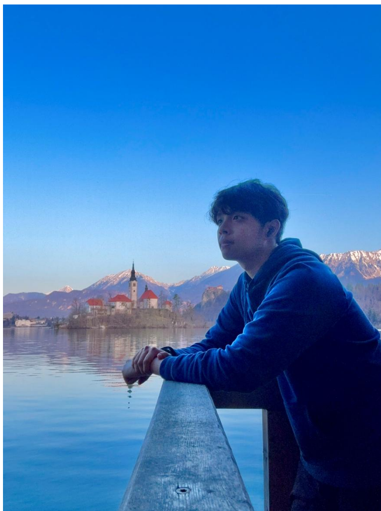
Figure 4.12 波斯托伊那鐘乳石洞、盧比安納飛龍之橋、布萊德湖