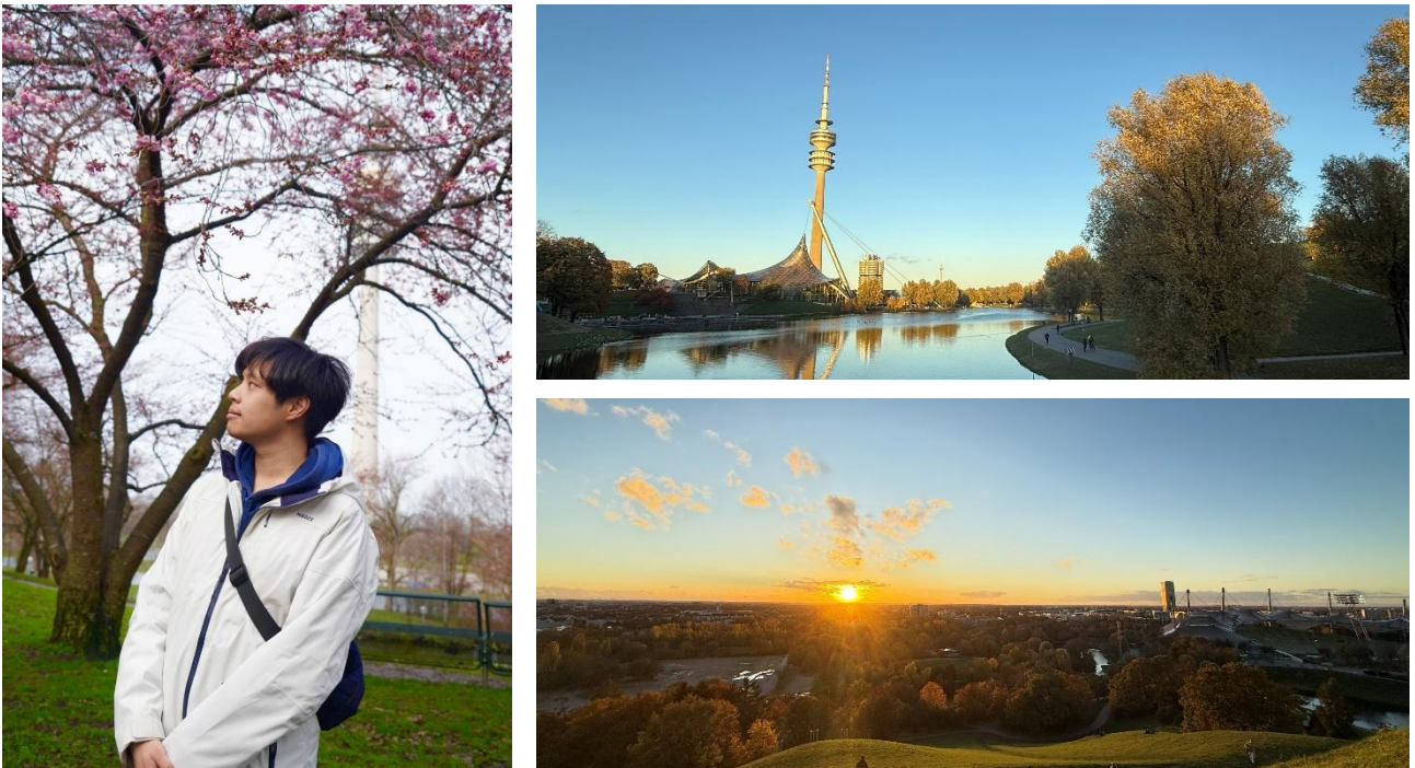
Figure 3.5 TUM Olympia 校區奧林匹亞公園

當然 Main Campus 我也是有到訪過，也就是領取學生證跟購買 ESN 卡的地方，一樣是在 U6 線上的 Universität 站上，因為靠近老城區，整個非常有文藝氛圍，秋天剛開學時走到校園的路上可以欣賞沿街漂亮的黃色落葉景觀，加上慕尼黑老城區整體建築物都是白灰色、黃褐色的外觀，因此整體顯得相當樸實整齊劃一，有一種在理性之中流露出的感性之美。而校園建築的內裝也是相當唯美，有一種走進美術館的感覺，相當寧靜莊嚴。不過當初十月中旬的