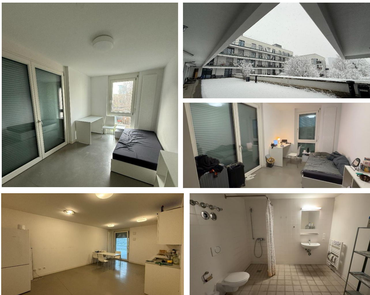
Figure 3.2 慕尼黑住宿