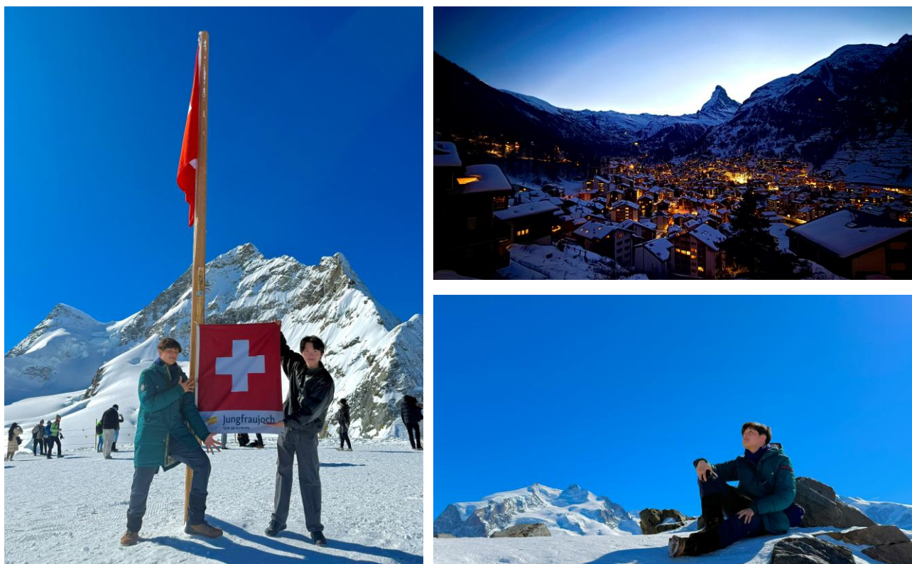
Figure 4.10 瑞士少女峰、策馬特、馬特洪峰

六天的時間，我們從蘇黎世登陸，一路向南往因特拉肯，也就是那個夾在上帝左右眼之間的小鎮，再往下到夢幻小鎮策馬特，主要目標當然是要盡可能享受瑞士的自然風光。先提一下上帝的左右眼，分別為因特拉肯左邊的圖恩湖以及右手邊的布里恩茲湖，真得說，兩座湖泊的湖水都是我在歐洲見過最清澈的湖水，在2月下旬和煦的陽光照耀下，都散發出閃閃發光的藍寶石光暈，湖泊依傍著四周壯麗的群山，群山就好似上帝細心烘焙的巧克力布朗尼，那融雪就宛如上帝灑下的糖粉一般，多麼的美麗，親眼目睹這份美好，彷彿一切的煩惱都在這一刻徹底一掃而空，心靈也隨之徹底被淨化。我同時也克制不住內心的衝動，試著用手撈起一些湖水，並且就這樣灌入口中，那是無比的乾淨無味，沒有任何礦物質的苦澀感，只有靈魂被潔淨的滋潤感，真是太美好了。在因特拉肯的四天三夜，我們入住了一間由一位爺爺經營的民宿，小小的房間從床上一起身就可以從眼前的窗外看到群山美景，被單上的花紋讓我有種回到了鄉下外婆家的感覺，我們倆那三個晚上都從瑞士的 coop 超市，買了點現烤 Pizza、兩盒烤雞腿、一碗泡麵跟飲料來吃，這樣的吃法比起在其他國家旅遊，貪圖享受的人類在外食可能一次都要花費20、30歐元來說，這樣總計不到20歐元的價格，相對已經便宜許多了，而且甚至還讓我覺得格外美味，這樣溫暖的瑞士夜晚，也是我那六天的瑞士之旅難以忘懷的小確幸之一。