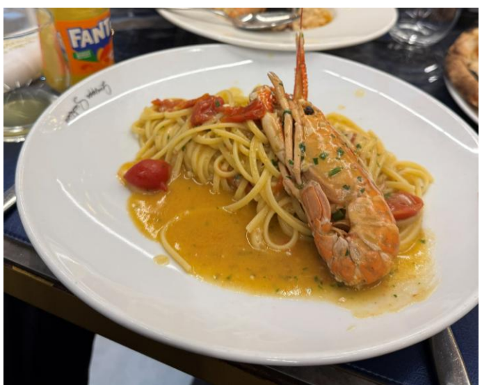
Figure 4.8 義大利美食

真的感謝義大利帶給我的所有燦爛回憶，將近兩週的旅程，每時每刻無不被義大利的美給迷惑，米蘭大教堂、佛羅倫斯的米開朗基羅廣場夜景、哀傷的龐貝城與那布勒斯聖埃莫堡的壯麗藍調時光夕陽景致，真的處處都在向我訴說它的愛意，希望藉由拾獲這份美好，能讓我未來有機會再度重返義大利的懷抱，擁抱它的文化與歷史美景，擁抱它的豐富美食，並再度把舉國之愛，掌握手中～