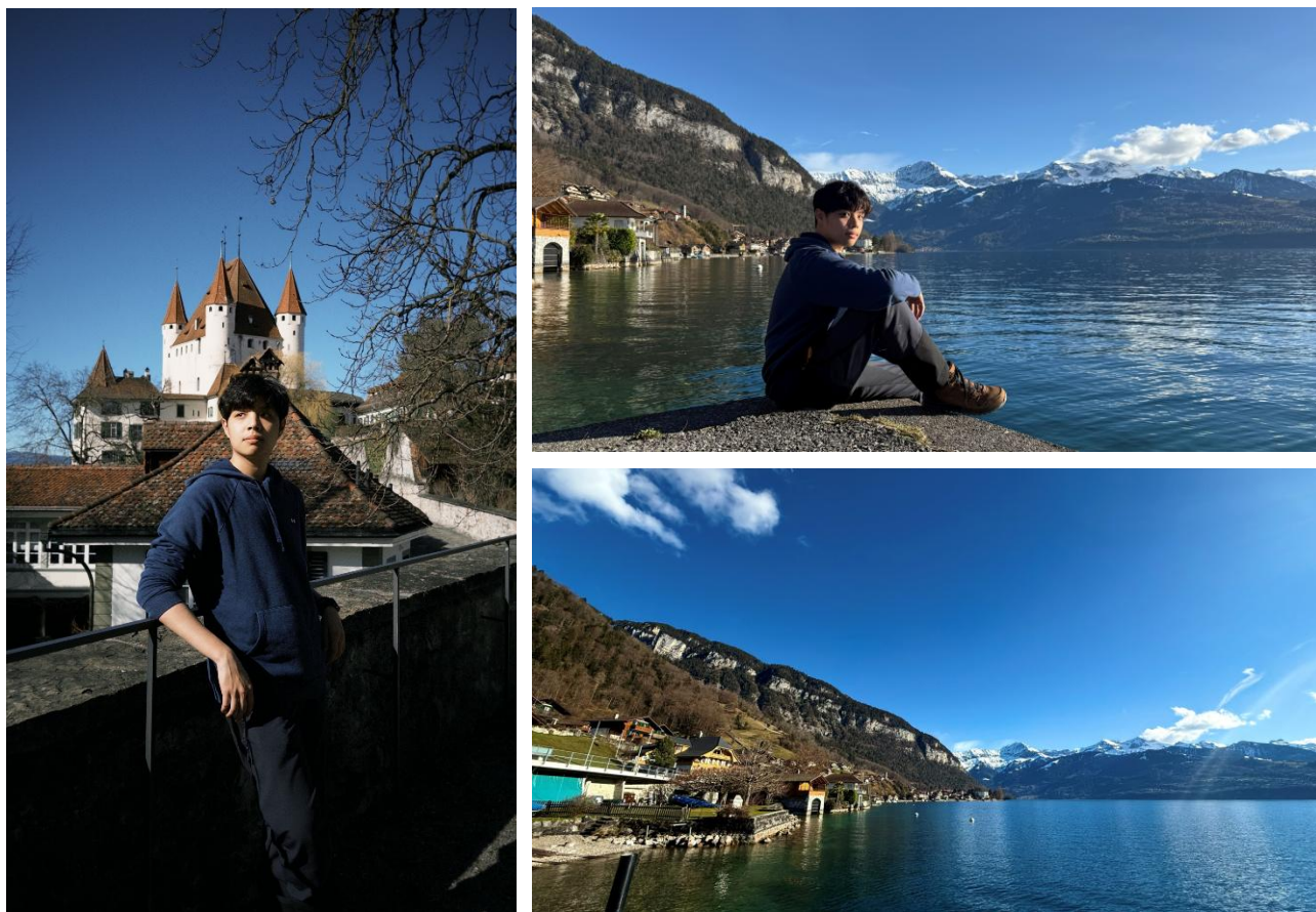
Figure 4.9 瑞士圖恩城堡、圖恩湖

11月初法國之旅接近尾聲的時候，成大的 Casper 以及交大的 Wesley 這兩個旅伴就已經在討論他們那毫無規劃的11月中旬要去哪？我幼稚的表示：「小弟要去北極看一趟極光，哈哈你們看不到咧～」這句話似乎完美的戳到了他們倆不服輸的旅遊之魂，於是他倆當即決定要趁這個鄰近25歲的尾聲去一趟瑞士！啊～這實在是完美的反擊，不知多少次都會在旅遊書上看到瑞士巍峨的群山峻嶺，以及唯美炫麗的湖泊景觀，尤其是未滿25歲的年輕人，仍然被瑞士的旅遊之神歸類為「年輕人」，因此還得以購買相比原價便宜許多的「瑞士青年票」暢遊整個瑞士。對我來說，這個「貴的要命王國」就是這麼有吸引力，當我唉聲跪地祈求他倆帶我一程時，這兩人卻毫不猶豫選擇我前往北極的那幾天，捷足先登前往那片淨土，唉...真是太沒情沒義了～因此這個瑞士之旅的計畫就暫且被我擱置了一陣子，直到2026年2月底期末考結束之後，當我在思考是否該逃離寒冷的慕尼黑前往南法享受尼斯的陽光之時，這個回憶就像閃電一般突然灌入我的腦袋，正巧距離25歲也只剩兩週，因此這瑞士行可謂曰勢在必行，就這樣，2月23日，找上認識的台大夥伴 Jason，並且情勒 Casper 交出行程後，兩個未滿25歲的年輕人就這麼出發了～