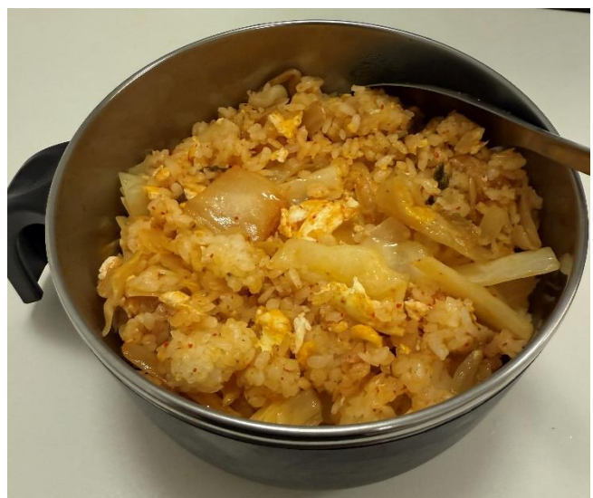
Figure 3.1 慕尼黑的自煮成果展