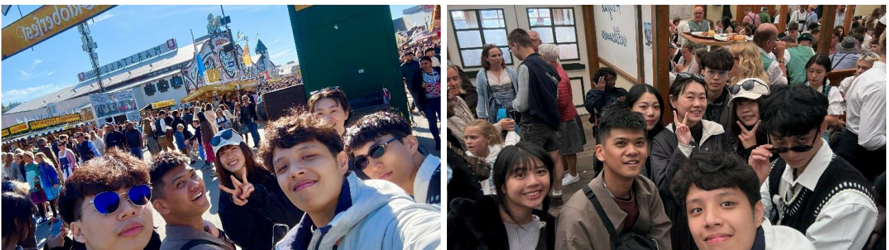
Figure 4.1 慕尼黑 Oktoberfest

10月03日，眾人去參加了 Oktoberfest，在那裡我們反而沒喝半杯啤酒，只能說慕尼黑真是「醉」過啊～光是在會場外暢飲一杯就要5.5歐元，在會場內價格更是恐怖。不過我們也因此領教到德國當地居民的熱情。不過據後來與德國朋友以及歐洲認識的留學生朋友聊過之後，我才理解其實歐洲人的邊界感其實是很重的，因此或許對他們來說，暢飲才是打開他們社交閥門的一個方式，也只有每年的此時此刻，他們才能蕪露他們一直以來隱藏起來的奔放與歡愉，或許這就是歐洲酒精文化的真諦吧～