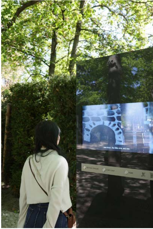
在柏林旅遊並了解德國歷史