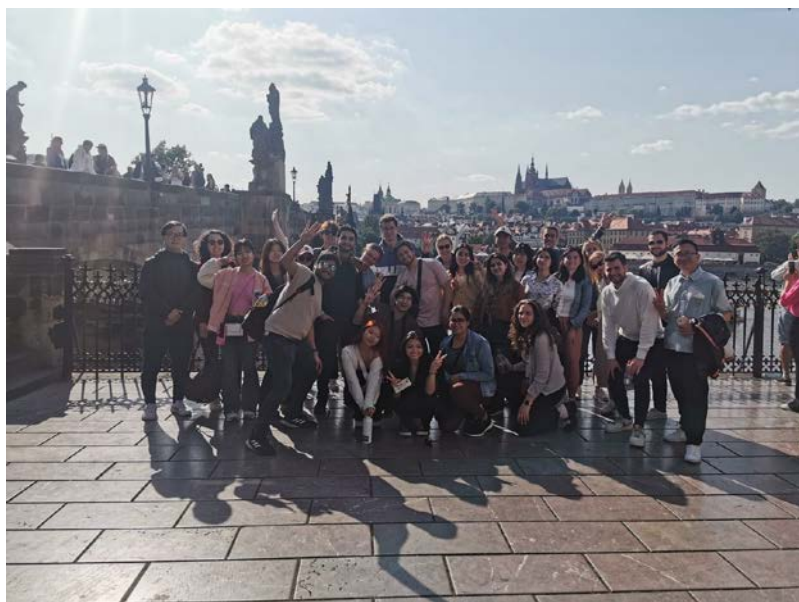
TUMi活動-捷克布拉格三天兩夜之旅