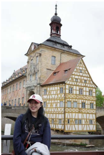
TUMi活動-班貝格文化之旅