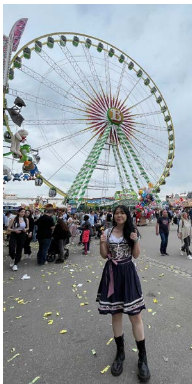
體驗德國傳統服飾