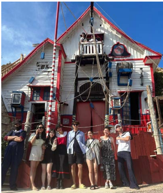
跟旅伴在馬爾他旅遊