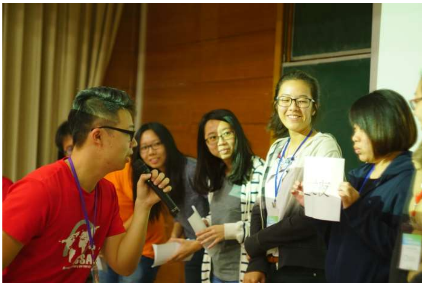
駭客松-組員挑選題目