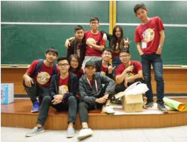
106 學年僑聯幹訓-幹部合照