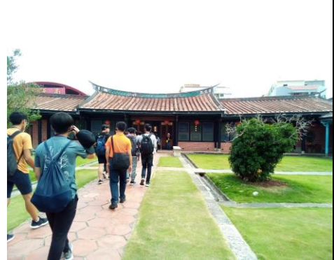
林家花園內美景欣賞