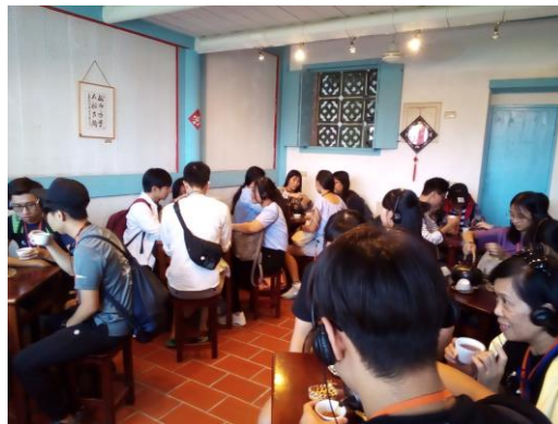
在宮保第的紅茶品嘗時間