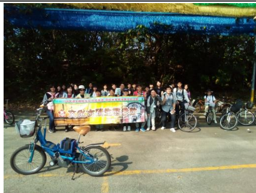
后豐鐵馬道出發騎車前合影