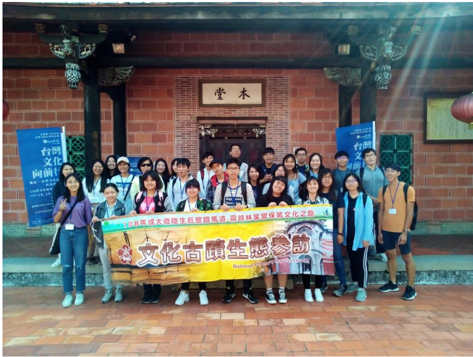
霧峰林家宮保第園區大合照