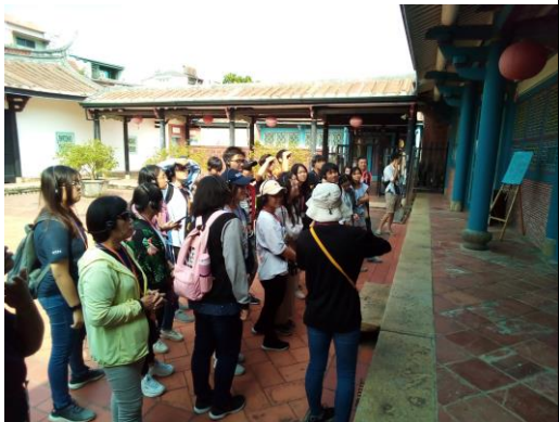
同學們認真聆聽導覽解說