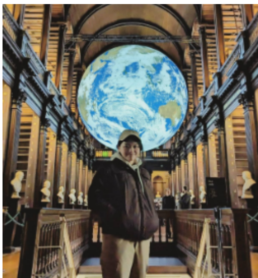
TCD 的 Book of Kells 古老圖書館