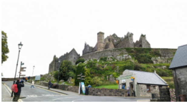
廢棄的天主教集會地 Rock of Cashel