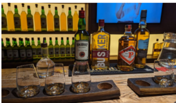
Whiskey Museum 品嘗著名的愛爾蘭威士忌