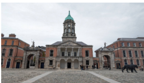
Dublin Castle 現在仍為政府機關