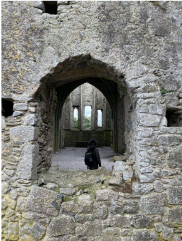
Rock of Cashel 內部