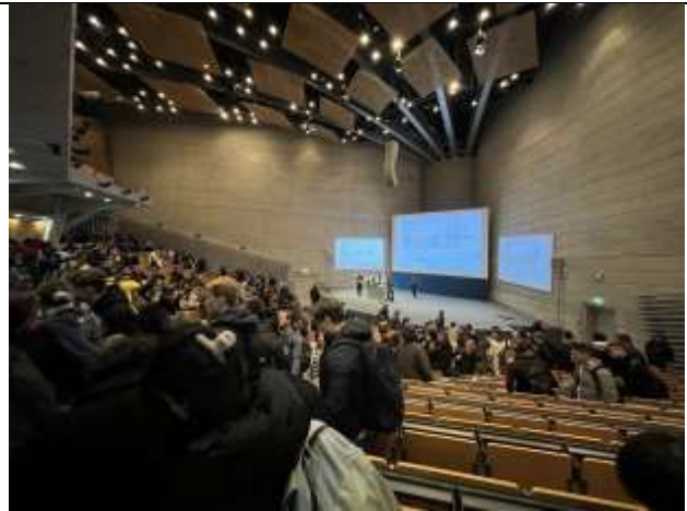
慕尼黑工業大學主校區 Audimax 講堂