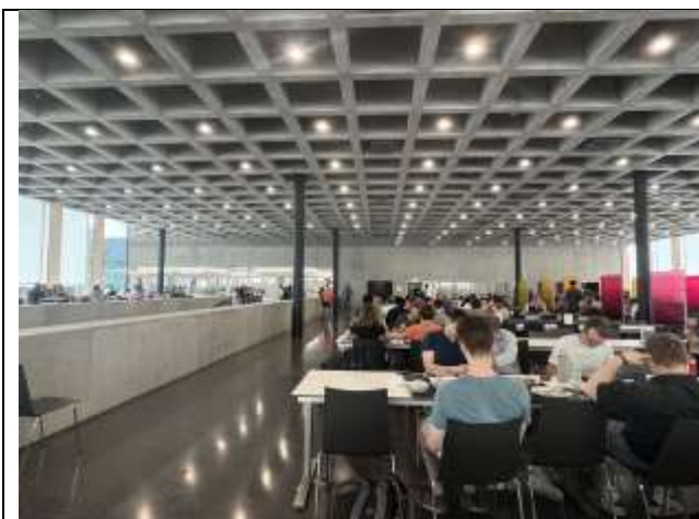
TUM Garching 校區 Mensa (學生餐廳)