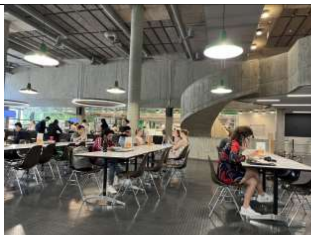
TUM 主校區 Mensa (學生餐廳)