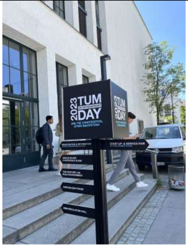
TUM Entrepreneurship Day 活動