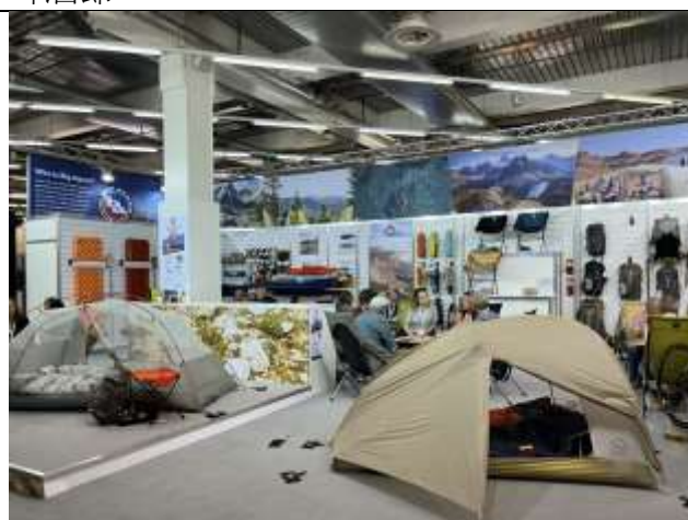
慕尼黑運動用品展