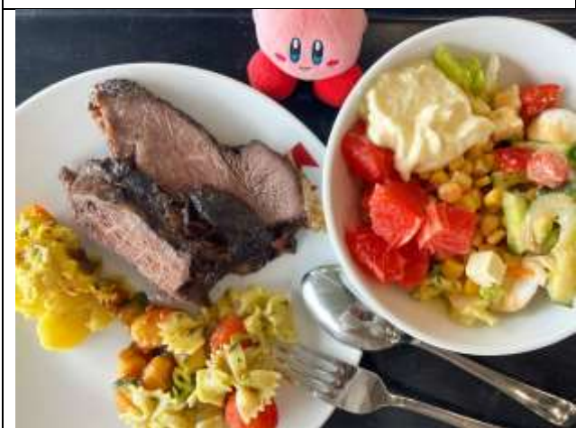
TUM 主校區 Mensa (學生餐廳)