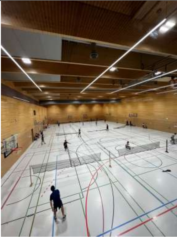
TUM ZHS 運動中心羽毛球館