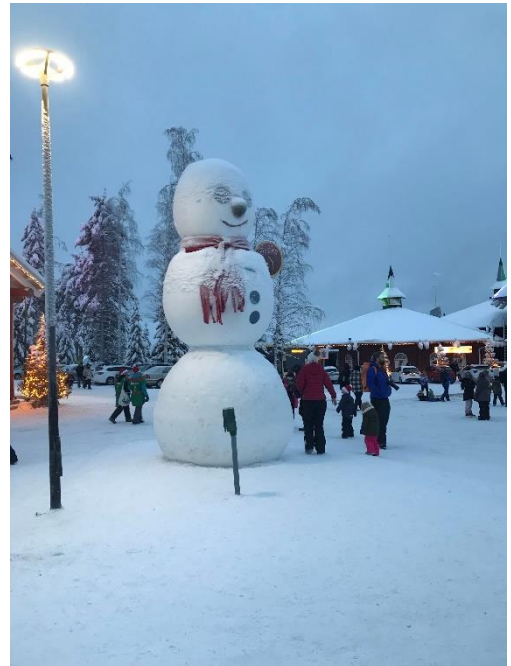
聖誕老人村大雪人