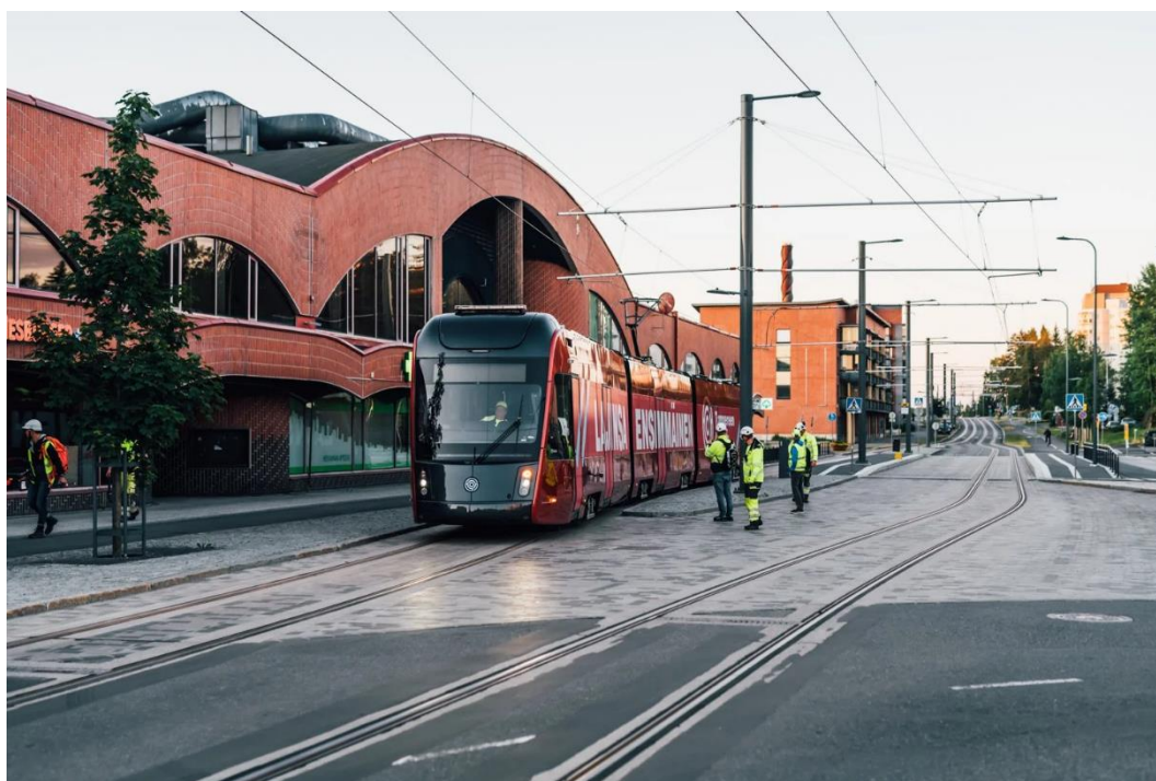
輕軌及 Hervanta 校區周圍