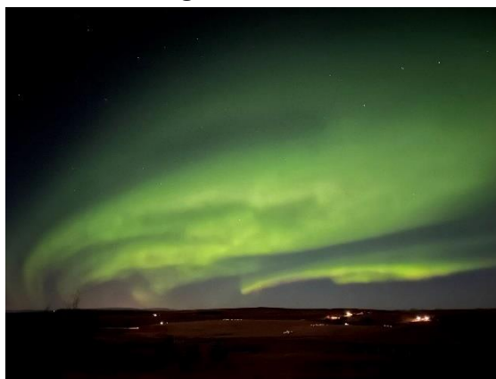
雷克雅維克的極光