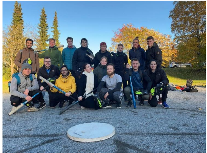
Pesäpallo Pelaaminen 打芬式棒球