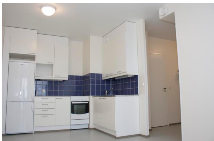
公共空間(廚房含冰箱烤箱微波爐)