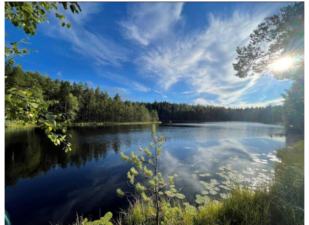
Särkijärvi 湖 (天氣晴朗時)