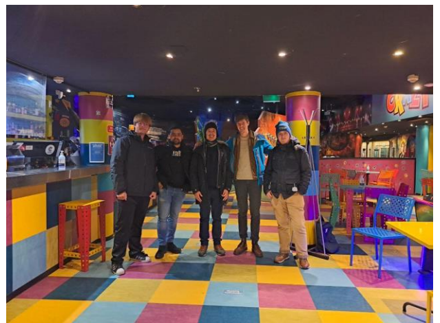
與組員打迷你高爾夫