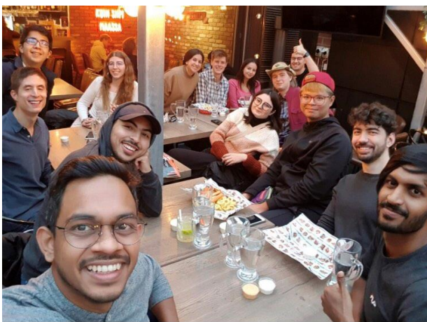
泡完桑拿之後的聚餐