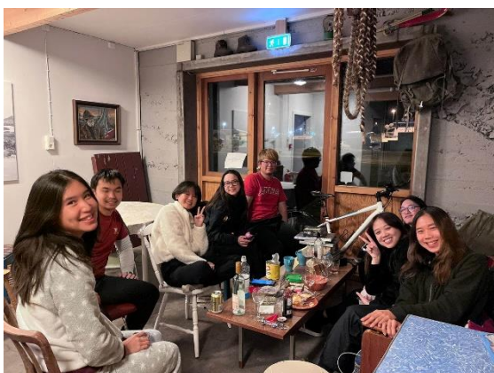
晚上桌遊真心話大冒險時間