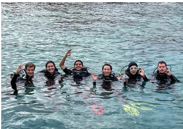
圖4 科曲大學潛水社團出遊

樂: 伊斯坦堡有很多娛樂場所，須注意不要輕易答應陌生人邀約，具有安全意識，市區也有許多人文觀光選擇，推薦以學生證取得博物館卡將能免費通行大多數博物館，若在伊斯坦堡觀光已久，想要領略其他城市風光，通過高速火車及巴士跨城市旅行也是很好的選擇，通常學生社團會安排相關活動，可以多加關注。