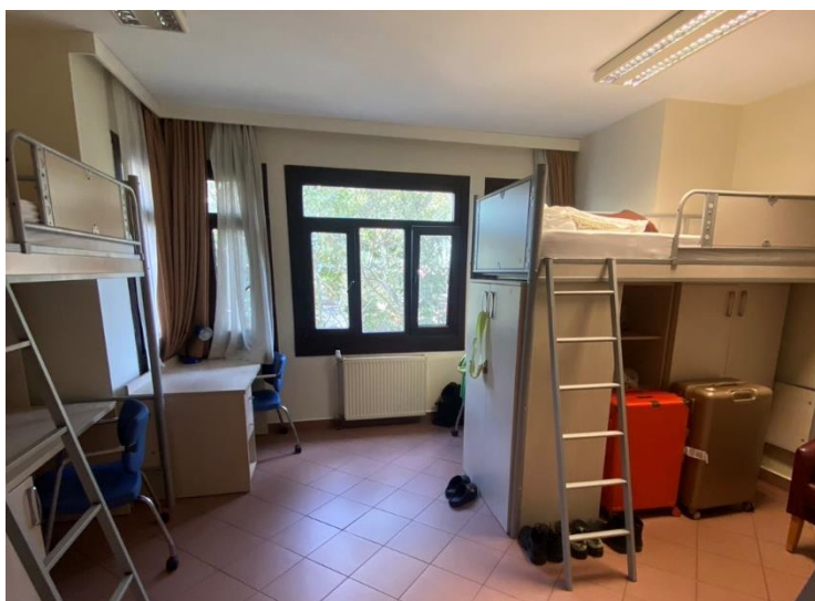
圖2 西校區學生宿舍

補充說明:將近4個月的三人房住宿(含水電)、共用房間外衛浴約為台幣55000元及押金4000-5000元，且須透過信用卡付款。