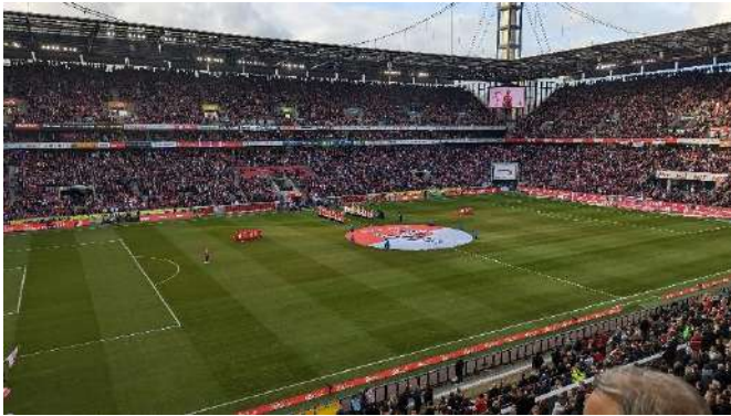
德甲足球-科隆萊茵能源球場