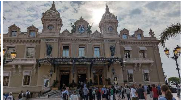
摩納哥-蒙地卡羅賭場