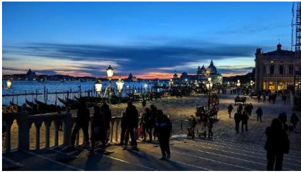
義大利-威尼斯聖馬可廣場