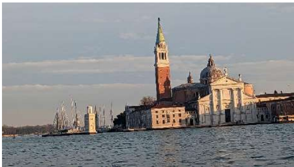
Church of San Giorgio Maggiore