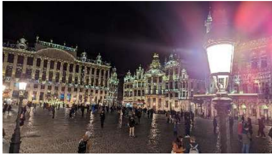
布魯塞爾-最美廣場