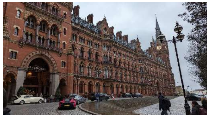
St Pancras 火車站