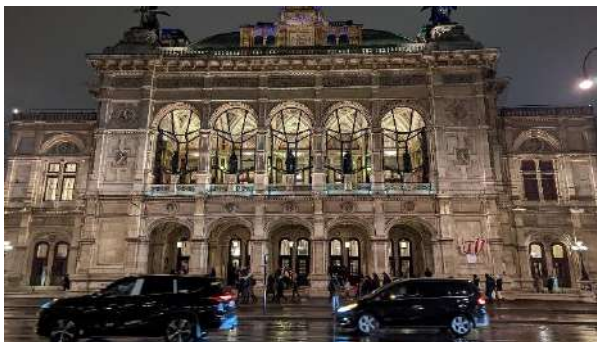
維也納國家歌劇院